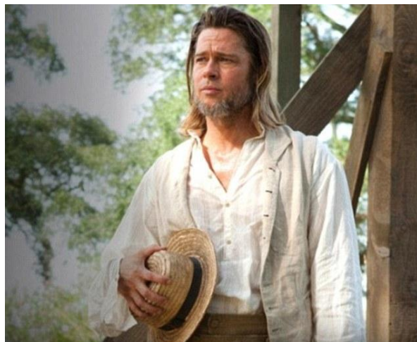
تصویر شماره ۱: براد پیت

سیاه‌پوستان قلمداد می‌شود (تیلور، ۲۰۰۰). براد پیت در سن ۵۰ سالگی چنین نقشی را ایفا می‌کند تا تشابه سنی او با لینکلن نیز این گفتمان را قابل‌باورتر بنمایاند.