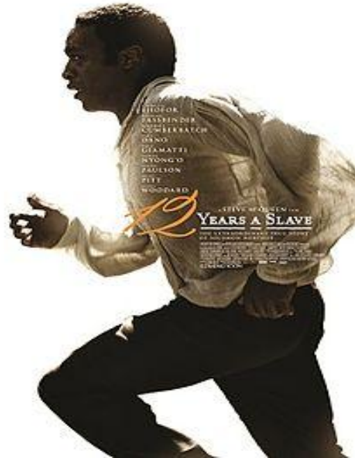
تصویر شماره ۴: یکی از پوستره‌های تبلیغاتی فیلم ۱۲ سال بردگی