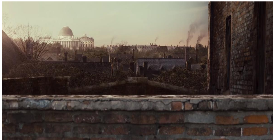
تصویر شماره ۵: کاخ سفید در نمایی از فیلم ۱۲ سال بردگی