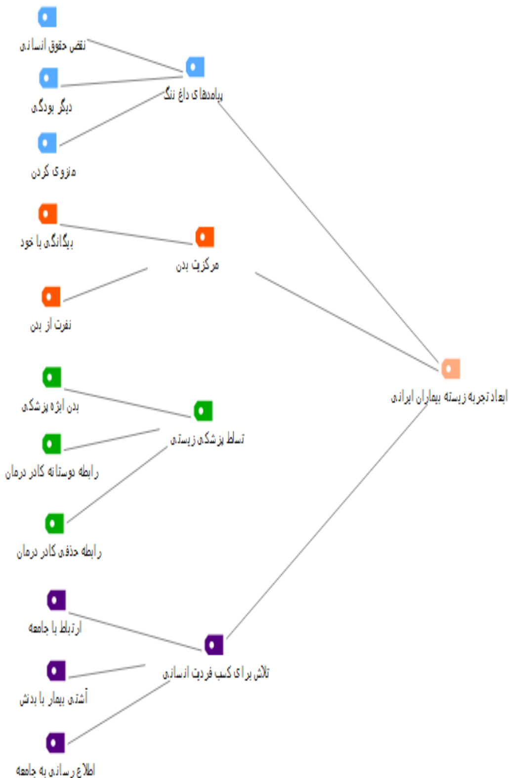
شکل شماره ۲: ابعاد تجربه زیسته بیماران ایرانی