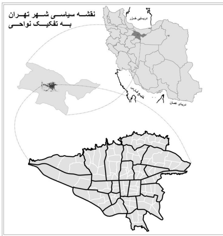
شکل شماره ۱. محدوده سیاسی نواحی شهر تهران

منطقه بلکه حتی خود پایتخت نیز با کمبود آب روبروست (نوری کرمانی، ۱۳۸۳: ۹۷).