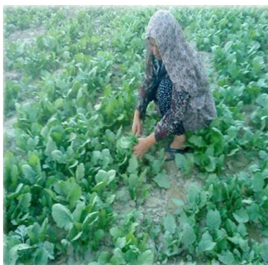
شکل ۳- نمونه‌ای از فعالیت وجین کاری، ۱۳۹۲

طبق تحقیقات میدانی مشخص گردید که زنان روستایی مورد مطالعه، سهمی عمده در فعالیت‌های کشاورزی دارند، به طوری که اهم کارهای کشاورزی مثل وجین کاری به طور متوسط ۲ ساعت از وقت شان را در شبانه روز می‌گیرد. همچنین حدود ۲ ساعت از شبانه روز را نیز صرف آبیاری محصولات کشاورزی می‌کنند. هر چند که در تقسیم جنسیتی کار، در سایر نقاط ایران معمولاً آبیاری توسط مردان انجام می‌شود، اما در این منطقه زنان نیز در این فعالیت مشارکت دارند. علاوه بر آبیاری محصولات