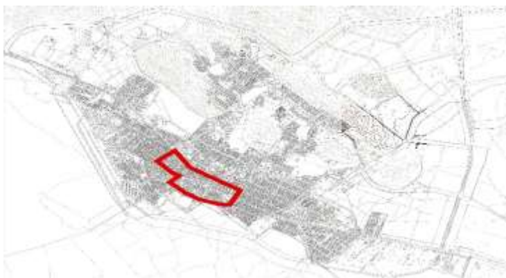
شکل - ۴: نقشه موقعیت محدوده بافت فرسوده شهرکرد