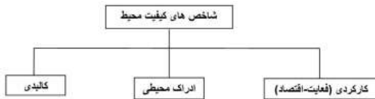
شکل - ۲: شاخص‌های کیفیت محیط