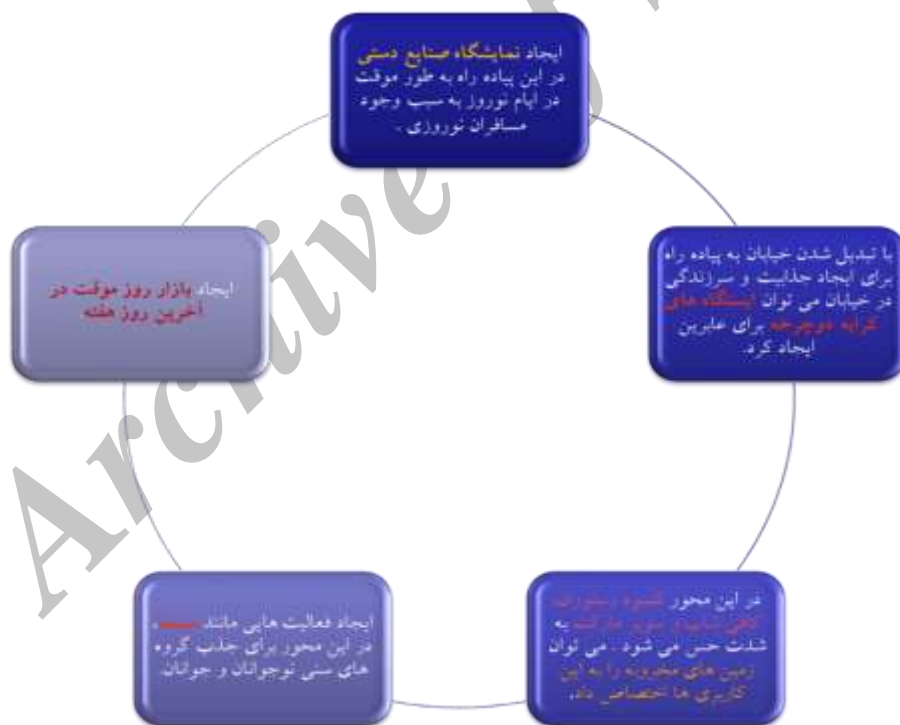
شکل - ۶: کاربری‌های پیشنهادی، مأخذ: نگارنده

کاربری‌هایی که در افزایش نشاط و سرزندگی می‌توانند تأثیرگذار باشند در ادامه آورده شده‌اند.