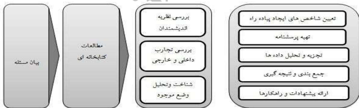
شکل - ۱: فرایند پژوهش

باتوجه به وجود ۲ جامعه آماری متفاوت در این پژوهش (کسانی که دائم در محورها و کسانی که به‌طور موقت از محور گذر می‌کنند) کوشش شد موضوع پژوهش از هر دو دیدگاه بررسی شود. روش نمونه‌گیری، تصادفی ساده بود و برای هر دو گروه عابرن و شاغلان از این روش، با رابطه کوکران نمونه‌گیری شده است. تعداد حجم پرسش‌نامه با فرض نامعلوم بودن تعداد کل عابرن جامعه آماری (N)، با رابطه n = \frac{z^2 pq}{d} ، d=0/1 ، p,q=0/5 و z=1/96 و با ضریب اطمینان ۹۵ درصد محاسبه شده که بر این اساس ۹۶ نمونه بوده است. تعداد نمونه برای پرسش‌نامه شاغلان با برداشت میدانی تعداد ۵۶۰ مغازه یعنی، N=560 ، d=0/1 ، p,q=0/5 و با ضریب اطمینان ۹۵ درصد با رابطه n = \frac{Nz^2 pq}{Nd^2 + z^2 pq} محاسبه شده که بر این اساس ۸۲ نمونه بوده است. باتوجه به محاسبات انجام شده، تعداد پرسش‌نامه‌های ویژه عابرن، ۹۶ و تعداد پرسش‌نامه‌های مربوط به شاغلان ۸۲ عدد بوده است. مجموع پرسش‌نامه‌ها ۱۷۸ است.