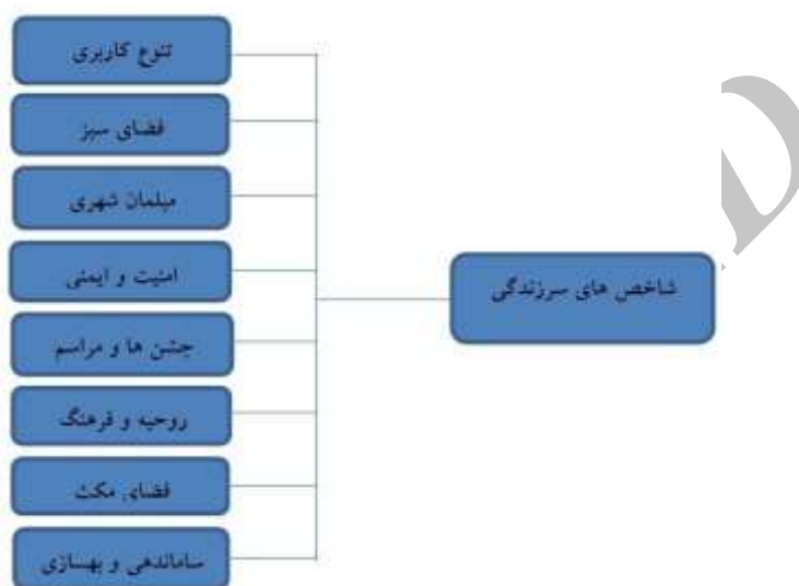
شکل - ۳: شاخص‌های سرزندگی