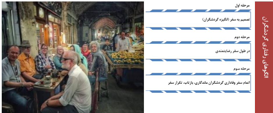
شکل - ۱: گردشگران و الگوهای رفتاری گردشگران

گردشگری، لطیف ترین ابزار پاسخگویی به بسیاری از نیازهای بشر است که از دیرباز بر آن تأکید شده است و با انسان، انگیزه‌ها و نیازها ارتباط دارد و به تعالی تعامل او با دیگران منجر می‌شود. در واقع گردشگری به مثابه یک عامل تحول ارزشمند در زندگی افراد حضور پررنگی داشته است.