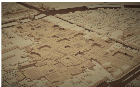
شکل - ۵: بافت متراکم، پیوسته و منسجم بازار تاریخی تبریز با محیط پیرامون در وضعیت کنونی (ترسیم: نگارندگان، ۱۳۹۷)

به طور کلی بازار تبریز، شبکه‌ای ارتباطی متشکل از تعدادی راسته‌های موازی و متقاطع است. دو راسته اصلی آن عبارت از دو راسته شمالی - جنوبی است که با اندکی جابه‌جایی با یکدیگر موازی و دربرگیرنده بخش‌هایی چون تیمچه‌ها، دالان‌ها، راسته‌ها، بازارچه‌ها، سراها و کاروانسراها، مساجد، مدرسه و کتابخانه، حمام و پل بازارها هستند.