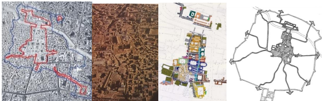
شکل - ۴: عکس هوایی محدوده بازار تبریز و حصار و دروازه‌های شهر تبریز و مجموعه بازار (ICHHTO, 2009: 466- 589)

به طور کلی بازار تبریز، شبکه‌ای ارتباطی متشکل از تعدادی راسته‌های موازی و متقاطع است. دو راسته اصلی آن عبارت از دو راسته شمالی - جنوبی است که با اندکی جابه‌جایی با یکدیگر موازی و دربرگیرنده بخش‌هایی چون تیمچه‌ها، دالان‌ها، راسته‌ها، بازارچه‌ها، سراها و کاروانسراها، مساجد، مدرسه و کتابخانه، حمام و پل بازارها هستند.