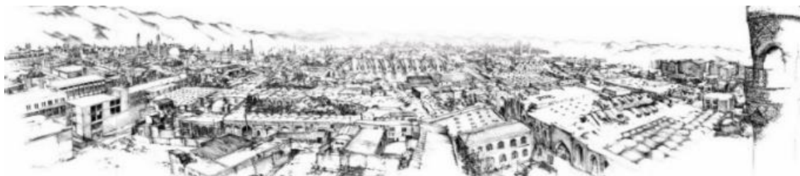
شکل - ۳: مجموعه بازار تاریخی تبریز (ICHHTO, 2009: 17)

بازار تاریخی تبریز، یکی از مهم‌ترین عناصر و هسته اصلی شهر و وسیع‌ترین مجموعه بازار تاریخی و مسقف جهان با ویژگی‌های منحصربه‌فرد، در مسیر جاده تاریخی ابریشم قرار گرفته و در فهرست میراث جهانی یونسکو به ثبت رسیده است. با ثبت شدن بازار تبریز در فهرست میراث جهانی، ضمن ارتقای فرهنگی و اجتماعی کشور و منطقه در جهان، خیل انبوه گردشگران برای بازدید از آن به ایران سفر کرده‌اند.