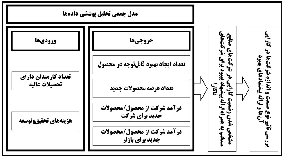
شکل (۱): مدل بررسی کارایی نوآوری در شرکت‌های چهار صنعت پیشرفته ایران