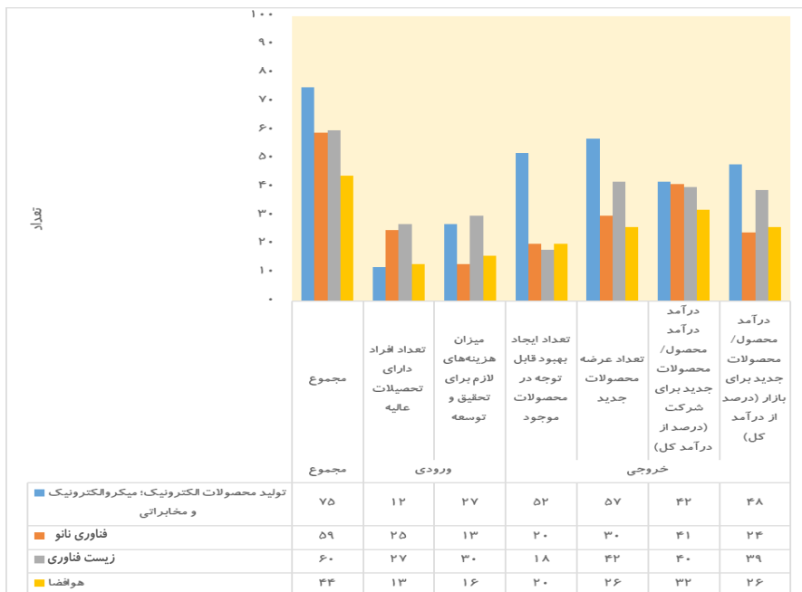
شکل (۴): تعداد شرکت‌های دریافت کننده پیشنهاد بهبود برای دستیابی به کارایی

در ادامه با استفاده از شکل (۴)، به تفکیک صنعت و شاخص‌های ورودی و خروجی، تعداد شرکت‌هایی که پیشنهاد بهبود دریافت کرده‌اند مشخص شد. علاوه بر این در جدول (۴) درصد شرکت‌هایی که در هر یک از صنایع پیشرفته منتخب، پیشنهاد بهبود برای دستیابی به مرز کارایی دریافت نمودند نمایش داده شده است. جدول (۴) نشان می‌دهد که تعداد شرکت‌های بیشتری در شاخص خروجی پیشنهاد افزایش داشته‌اند تا اینکه در شاخص‌های ورودی پیشنهاد کاهش دریافت نمایند. این موضوع در حوزه‌های تولید محصولات الکترونیک، میکروالکترونیک و مخابراتی و هوافضا کاملاً مشاهده شد زیرا درصد دریافت پیشنهاد افزایش شرکت‌ها در هریک از شاخص‌های خروجی بیشتر از پیشنهاد کاهش برای هر یک از شاخص‌های ورودی