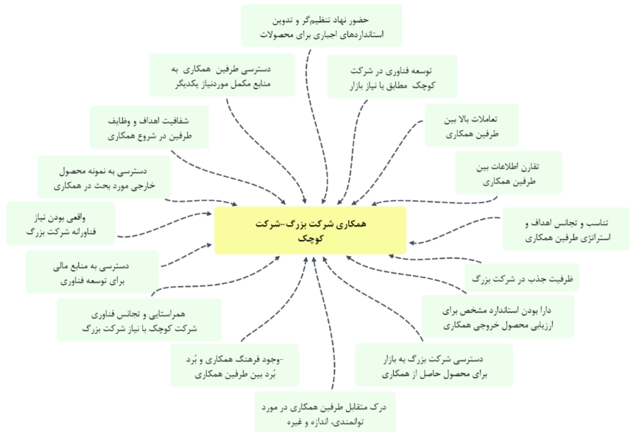
شکل (۳): عوامل ضروری برای موفقیت همکاری فناورانه نامتقارن در حوزه نانوفناوری ایران

فهرست ۱۶ عامل ضروری برای موفقیت همکاری فناورانه نامتقارن در حوزه نانو فناوری ایران در شکل (۳) نمایش داده شده‌اند.