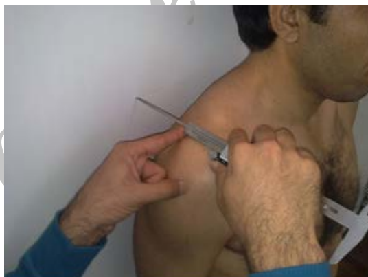
شکل 1: اندازه گیری فاصله آخرومی

اندازه گیری فاصله آخرومی 4 : فاصله آخرومی فاصله بین لبه خلفی زائده آخرومی استخوان کتف تا دیوار است که در وضعیتی که آزمودنی پشت به دیوار باشد اندازه گیری می شود. آزمودنی در وضعیت پشت به دیوار به طوری که پشت پاشنه و تنه روی دیوار قرار داشت و به حالت ریلکس می ایستاد. ابتدا فاصله افقی بین لبه خلفی زائده آخرومی استخوان کتف تا دیوار با استفاده از کولیس در این حالت اندازه گیری می شد. سپس آزمودنی هر دو شانه خود را در جهت دیوار بطوری که پشتش بر روی دیوار بماند و وضعیت قبلی را حفظ کند بالا می آورد. مجدداً در این حالت فاصله افقی بین لبه خلفی زائده آخرومی استخوان کتف تا دیوار اندازه گیری می شد. سپس اختلاف این دو فاصله به عنوان فاصله آخرومی ثبت می شد (21). (شکل 1)