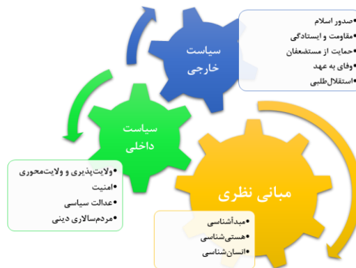
نمودار شماره ۳