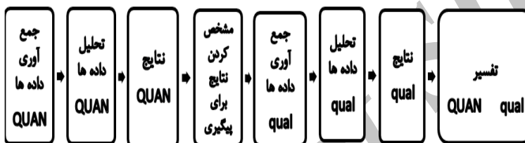
شکل ۱: طرح آمیخته تبیینی: از نوع پیگیری

جامعه و نمونه پژوهش: جامعه آماری شامل معلمان مدارس ابتدایی دولتی هوشمند شهر کرج است. تعداد مدارس ۳۰۰ مورد بوده (ناحیه ۱: ۵۴ مدرسه، ناحیه ۲: ۸۳ مدرسه، ناحیه ۳: ۱۰۰ مدرسه، ناحیه ۴: ۶۳ مدرسه) که از میان آن‌ها و به دلیل خوشه‌ای بودن نمونه‌گیری، ۳۰ مدرسه ابتدایی با رعایت وزن طبقه از نواحی چهارگانه کرج (ناحیه ۱: ۵ مدرسه، ناحیه ۲: ۸ مدرسه، ناحیه ۳: ۱۱ مدرسه، ناحیه ۴: ۶ مدرسه) انتخاب شده است. تعداد خوشه‌ها با استفاده از فرمول میانگین به ازای خوشه برآورد شده است که نمونه انتخاب شده به ازای جامعه، حجم مناسب و قابل قبولی می‌باشد. شایان ذکر است، از مجموع ۳۰ خوشه انتخاب شده، ۱۵۰ معلم به دست آمده است. برای فاز کیفی، از نمونه‌گیری هدفمند بهره گرفته شده و با توجه به معیارهای این نوع نمونه‌گیری، دو گروه ۶ نفره از معلمان به طور آگاهانه و هدفمند انتخاب شده‌اند. تعداد افراد هر گروه بر اساس معیار حداقل افراد مورد نیاز برای تشکیل یک گروه کانونی که شش نفر است، صورت گرفته است (بازرگان، ۱۳۹۱: ۷۸).