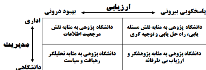
نمودار 2: چارچوب مفهومی دانشگاه پژوهی (ولکوائین، 1999)