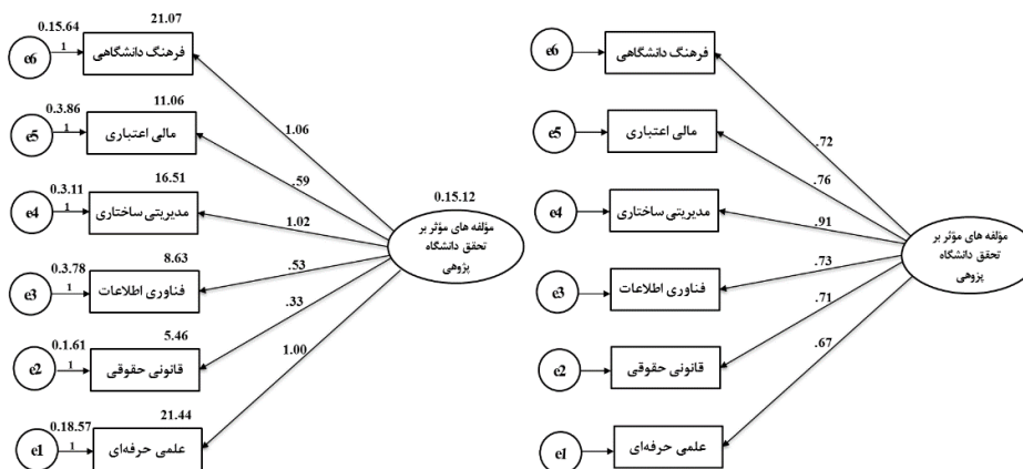
نمودار 3: مدل تحلیل عاملی تأییدی مؤلفه‌های مؤثر بر دانشگاه پژوهی در حالت ضرایب استاندارد نشده و ضرایب استاندارد شده

شاخص دیگر شامل جذر برآورد واریانس خطای تقریب (RMSEA) است که در ارتباط با آن، مقادیر بالاتر از 0/1، نشان از برازش ضعیف الگو و مقادیر متمایل به صفر، نشان از برازش خوب الگو است. در این پژوهش، RMSEA=0/05 به دست آمده است که نشان از برازش مطلوب مدل دارد. به طور کلی، هر یک از شاخصهای به دست آمده به تنهایی دلیل برازندگی یا عدم برازندگی مدل نیستند و این شاخصها در کنار هم باید مورد توجه قرار گیرند. مقادیر به دست آمده برای این شاخصها، نشانگر آن است که در مجموع، الگو در جهت تبیین و برازش، از وضعیت مناسبی برخوردار است و می‌توان گفت سؤال تحقیق مبنی بر اینکه الگوی مؤلفه‌های مؤثر بر تحقق دانشگاه پژوهی از شش مؤلفه اصلی تشکیل شده، مورد تأیید است. به عبارت دیگر؛ مطابق جدول 2، هر شش مؤلفه با 95 درصد اطمینان، زیرمقیاس مؤلفه‌های مؤثر بر تحقق دانشگاه پژوهی قرار می‌گیرند. در جدول 2 و نمودارهای 2 و 3، ضرایب استاندارد نشده و استاندارد شده و همچنین آماره معناداری هر یک از مؤلفه‌های الگوی تأیید شده، آورده شده است.