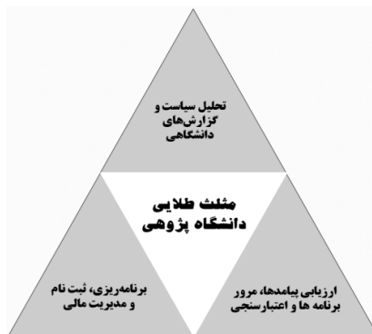
نمودار 1: مثلث طلایی دانشگاه پژوهی (ولکواين، 2008)

ولکواين 3 از جمله صاحب‌نظرانی است که مطالعات ارزشمندی طی دهه‌های اخیر در حوزه دانشگاه پژوهی انجام داده است. ولکواين (2008) کارویژه‌های دانشگاه پژوهی در دانشگاهها را در قالب مثلث طلایی دانشگاه پژوهی (مشمول بر: الف) تحلیل سیاست و گزارشهای دانشگاهی، (ب) برنامه‌ریزی، ثبت نام و مدیریت مالی، (ج) ارزیابی پیامدها، مرور برنامه‌ها و اعتبارسنجی، تعریف کرده است. وی معتقد است که پرچم‌ترین فعالیتهای واحد دانشگاه پژوهی در دانشگاهها، مربوط به ارزیابی پیامدها، مرور برنامه‌ها و اعتبارسنجی است (همان). واحدهای دانشگاه پژوهی در این بخش، اقداماتی نظیر اعتبارسنجی، تضمین کیفیت و ارزیابی درونی و بیرونی را در دانشگاهها دنبال می‌کنند که به طور مستقیم با مأموریت‌های اصلی دانشگاه پژوهی، که همان بهبود درونی و پاسخگویی بیرونی در راستای ارتقای کیفیت و اخلاق در دانشگاهها بوده، مرتبط است. (نمودار 1)