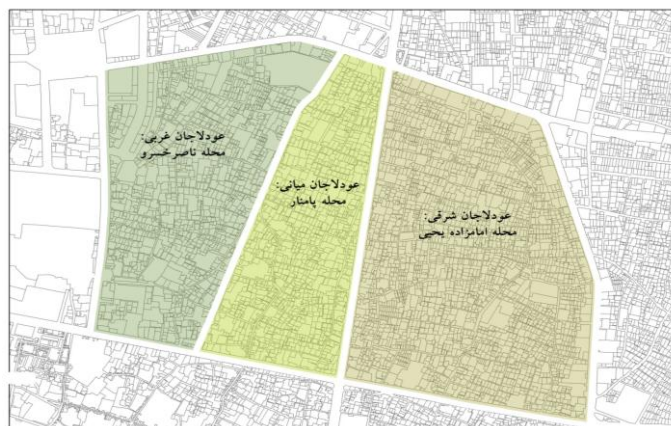
نقشه ۶. زیرمحله‌های عودلاجان

ناصرخسرو) نیز مرز میان این محله و ارگ حکومتی بود که پس از پرشدن خندق گرد ارگ در سال ۱۲۴۴ ش ( ۱۲۸۲ ق) ایجاد شد (فدایی نژاد و کرم پور، ۱۳۸۵). مرز جنوبی این محله که پیش از احداث خیابان بوذرجمهری (۱۵ خرداد کنونی) تا حوالی بازار مسگرها را در محله بازار کنونی در برمی گرفته است (نقشه‌های ۳، ۴ و ۵) پس از اجرای طرح «نقشه خیابان‌ها» و احداث خیابان بوذرجمهری در سال ۱۳۰۹ (عدل و اورکاد ۱۳۷۵: ۲۲۲)، همچنین الحاق بخشی از محله عودلاجان کهن به بازار، در حال حاضر بر خیابان ۱۵ خرداد منطبق است. خیابان‌کشی‌های سیروس (مصطفی خمینی کنونی) در زمان پهلوی اول و پامنار برخلاف مسیر گذر عودلاجان که بازار تهران را به ابتدای پامنار و محل دروازه شمیران در حصار صفوی وصل می‌کرد و ارتباطی ارگانیک با محله داشت، یکی از مشخصه‌های شهرهای کهن ایرانی بود (سلطان‌زاده، ۱۳۶۲: ۱۲۶). این خیابان‌کشی فاقد ارتباطی ارگانیک با کلیت محله بود و حاصل اتصال بخشی از گذر عودلاجان به خیابان بوذرجمهری به‌شمار می‌آمد. این فرایند در زمان پهلوی دوم و دهه ۱۳۴۰ محله را به سه پاره شرقی، میانی و غربی تقسیم کرد (نقشه ۶؛ کمیته هماهنگی، برنامه‌ریزی و طراحی بافت قدیم تهران، ۱۳۵۸: ۵۹) و آثاری را بر پایداری آن بر جای گذاشت (کمیته هماهنگی، برنامه‌ریزی و طراحی بافت قدیم تهران، ۱۳۵۸: ۶۷؛ فدایی نژاد و کرم پور، ۱۳۸۵). پس از این زمان مرزهای محله عودلاجان به شکل کنونی آن تثبیت شد.