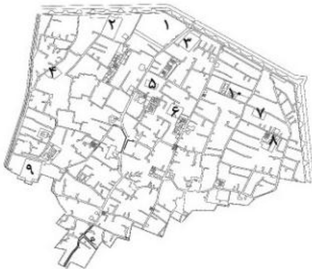
نقشه ۴. عودلاجان در سال ۱۲۳۷ شمسی