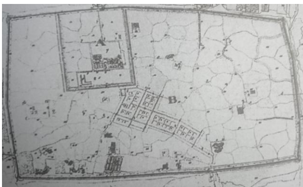
نقشه ۱. نخستین نقشه شهر تهران

نخستین نقشه تهیه شده از شهر تهران در سال ۱۲۰۵ شمسی (۱۲۴۱ق)، مقارن با بیست و نهمین سال سلطنت فتحعلی شاه به دست «نازکوف» یکی از افسران ارتش روسیه صورت گرفت (نقشه ۱). نقشه بعد را الیاس برزین، شرق شناس روس در سال ۱۲۳۱ ش (۱۲۶۸ ق) در چهارمین سال سلطنت ناصرالدین شاه و ۲۱ سال پس از نقشه نازکوف تهیه کرد (نقشه ۲) که نشان دهنده گسترش شهر در باغ ها و زمین های درون حصار صفوی است که البته در مقایسه با تحولاتی که تنها چند سال بعد، در پایتخت به وقوع می پیوندد چندان زیاد نیست.