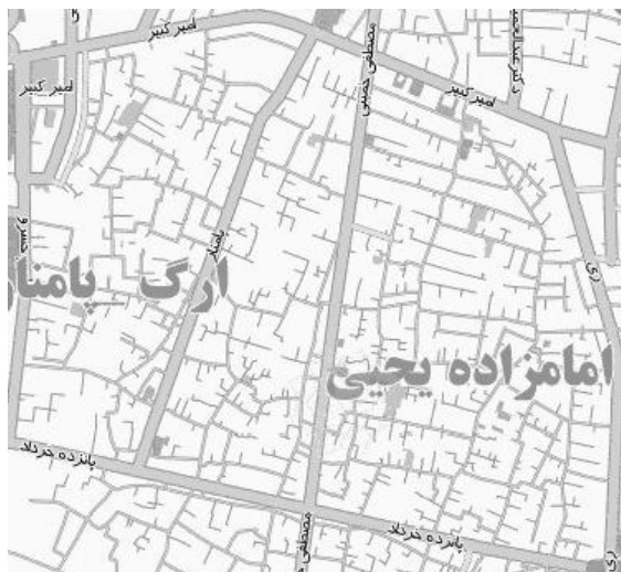
نقشه ۱. موقعیت کنونی محله عودلاجان