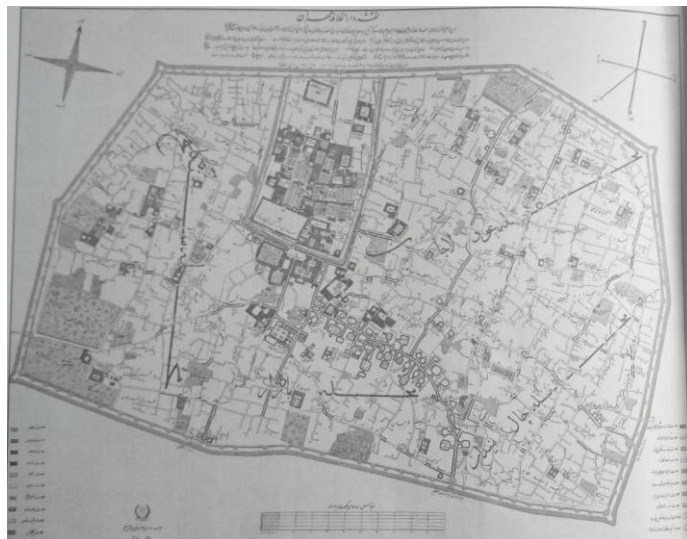
نقشه ۳. تهران در سال ۱۲۳۷ شمسی

منبع: آگوست کرشیش، ۱۲۳۷ به نقل از شیرازیان ۱۳۹۱: ۲۱