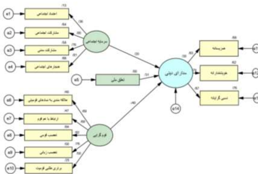
شکل ۲. مدل عمومی معادله ساختاری مدارای دینی و عوامل مؤثر بر آن

مدل عمومی معادله ساختاری، شکل توسعه یافته همبستگی است که هدف آن آزمون کمی مدل نظری است که رسم شد تا مشخص شود داده ها تا چه حد مدل نظری پژوهش را تأیید می کنند. البته این موضوع بیشتر به شاخص های برازش ارتباط دارد. نتایج تحلیل معادله ساختاری با استفاده از نرم افزار AMOS در شکل ۲ منعکس شده است.