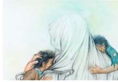
شکل ۳. بخشی از تصویر نگاره پناه

مجموعه آستان قدس رضوی، مجموعه آثار هنرمند