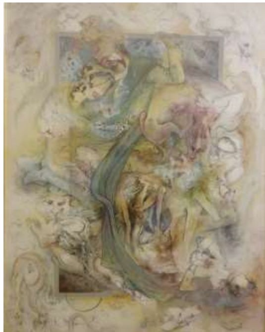
شکل ۵. در سیطره قدرت، ۱۳۵۶، موزه استاد فرشچیان

و زبان آن که امکان پرداخت مستقیم و صریح به موضوعات اجتماعی را نداشته و بیشتر به طور نمادین با ترکیب نقوش حیوانی و انسانی مسائل را طرح می‌کند (نگارگری)، فرهنگ تخصصی (نگره عرفانی هنر) و روحیات شخصی خود به ابراز انتقاد و واکنش خویش پرداخته و بنابراین نمی‌توان صراحت کارهای رئالیستی را از وی انتظار داشت. بر این اساس، انعکاس این التفات و ابراز عاطفی نسبت به شرایط اجتماعی و سیاسی در نگاره پناه نیز قابل‌ردیابی است. فرشچیان در همان سال نگاره‌ای با عنوان «در سیطره قدرت» (شکل ۵) با موضوع اجتماعی، انتقادی و اخلاقی دارد که یک حاکم ظالم را به همراه فرد دیگری که زن و همدست اوست (ظاهراً خواهر یا همسر) به تصویر کشیده است. اشخاص درون تصویر چنان مست قدرت‌اند که دچار کوری شده‌اند و ضمن آشامیدن خون موجودات مظلوم، همه چیز را زیر دست و پای خود قربانی کرده‌اند. این نگاره بازنمایی انتقادی شرایط اجتماعی و سیاسی حاکم و گویای احوال، مواضع و گرایش‌های درونی هنرمند است.