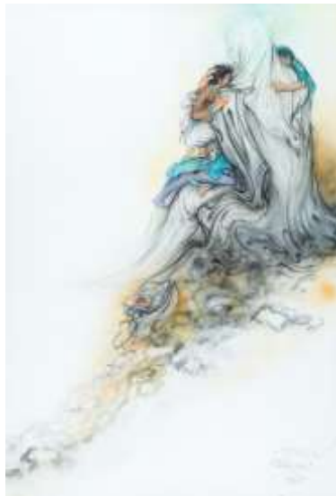
شکل ۲. پناه، ۱۳۵۶، مجموعه آستان قدس رضوی

خانواده که زیبایی‌شناسی خاصی را برای او بسترسازی کرده‌اند، خشوع و اخلاص اخلاقی و اعتقاد او به مظلومیت و تنهایی حضرت امیر در متن سوگواری به تمهیدات و ترکیبی خاص از عناصر انجامیده است. هنرمند با استفاده از فضای خالی، مادیت و محدودیت در زمان و مکان را کنار گذاشته و به مدد خطوط منحنی و غیرفیگوراتیو و مکان‌یابی در بالای تصویر، ضمن نفی جسمانیت از پیکره امام، بر قداست او تأکید ورزیده است. پرهیز از چهره‌پردازی و تلون نیز با قداست و شأن والای امام همراهی دارند. در مجموع این ساختار بصری تبلوری از خلوص قلبی هنرمند و فضای خانه و مادری است که ادراک هنری هنرمند را به سمت ساختاری محزون هدایت کرده‌اند که خشوع هنرمند و اهل خانه در برابر امام علی (ع) و غربت خود او را نشان می‌دهد. به نظر می‌رسد کنش مذکور بی‌ارتباط با شرایط اجتماعی و شرایط فرهنگی زمانه نبوده و از آن‌ها نیز تأثیر گرفته است.