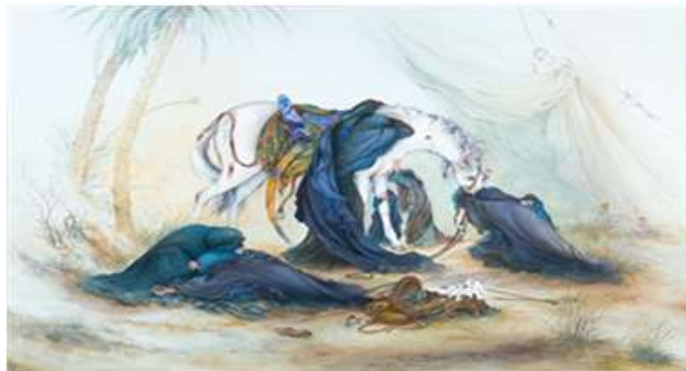
شکل ۶. عصر عاشورا، موزه آستان قدس رضوی، ۱۳۵۵

نگاره پناه در مناسبت شهادت امام اول شیعیان (۲۱ رمضان ۱۳۵۶) که غربت و مظلومیت او زبانزد تاریخ بوده خلق شده است. با توجه به زمینه شخصیتی و فرهنگی هنرمند، چرایی خلق این اثر به‌عنوان کنشی مذهبی در سوگواری امام اول شیعیان از یک سو و فرهنگ بنیادی جامعه که به ارزش‌های شیعی و سوگواری گرایش دارد از سوی دیگر توضیح داده شد. همچنین اینکه چرا موضوع اثر «یتیم‌نوازی» قرار داده شده، با ارجاع به خلوص قلبی و روحیه عاطفی هنرمند و فرهنگ سوگواری شیعیان برای امام علی (ع) و روضه‌های شب شهادت حضرت توجیه شد. با این حال، مضمون اثر لایه‌های معنایی دیگری مرتبط با زمینه اجتماعی و شرایط سیاسی و فرهنگی را دربرمی‌گیرد.