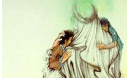
شکل ۴. بخشی از تصویر نگاره پناه