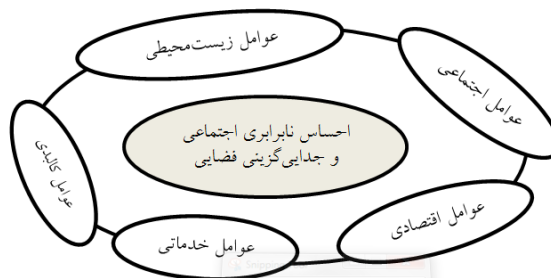
شکل ۱. عوامل اصلی احساس نابرابری اجتماعی و جدایی‌گزینی فضایی

در عین حال، از دهه ۱۹۶۰ به بعد، مفهوم و کارکرد عدالت اجتماعی وارد ادبیات جغرافیایی شد. هاروی عدالت اجتماعی را عاملی برای فائق آمدن بر تعارضاتی می‌داند که لازمه همکاری اجتماعی برای ترقی افراد است. در این میان، اصولی که از نظر عام پذیرفته باشد، برای عدالت اجتماعی وجود ندارد. در این میان، همواره این دو سؤال مطرح است که چه چیزی باید توزیع شود و این توزیع باید میان چه کسانی و چه چیزهایی باشد (هاروی، ۱۳۷۹: ۹۷-۹۹)؛ بنابراین عوامل گوناگونی مانند دسترسی به مسکن، برخورداری از خدمات، عدالت در توزیع کاربری‌ها، فاصله محل کار تا محل سکونت، کیفیت ساخت، اجزای کالبدی، طبقه اجتماعی و غیره در ترسیم وضعیت احساس نابرابری اجتماعی و جدایی‌گزینی فضایی ساکنان مسکن مهر در شهرهای جدید، نقش خواهند داشت. عوامل اصلی احساس نابرابری اجتماعی و جدایی‌گزینی فضایی در شکل ۱ آمده است: