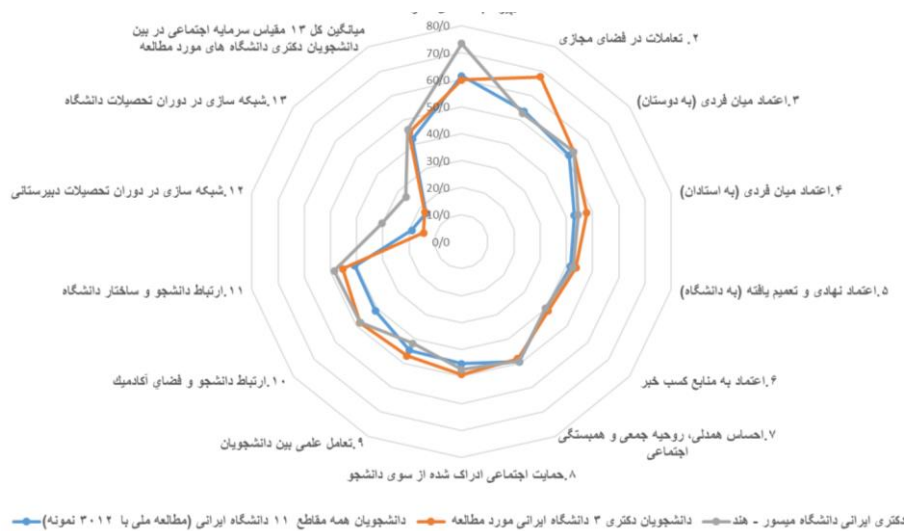
شکل ۳. مقایسه میانگین استاندارد شده مقیاس‌های سیزده‌گانه به تفکیک دانشجویان دکتری ایرانی در حال تحصیل در دانشگاه میسور هند و دانشجویان دکتری سه دانشگاه ایرانی و دانشجویان دکتری همه مقاطع تحصیلی یازده دانشگاه (نمونه ملی)