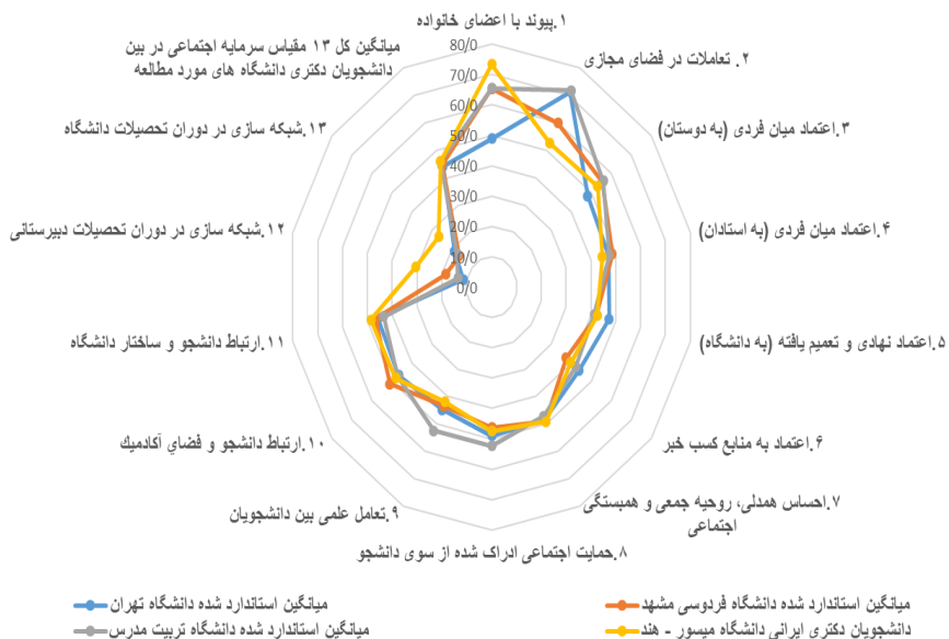
شکل ۲. مقایسه میانگین استاندارد شده مقیاس‌های سیزده‌گانه به تفکیک دانشجویان دکتری در دانشگاه‌های مورد مطالعه

بر اساس شکل ۲، دانشجویان ایرانی مقیم دانشگاه میسور در ارتباط با شاخص‌های سرمایه اجتماعی از دو دانشگاه تهران و فردوسی مشهد در سطح بهتری قرار دارند؛ به طوری که دانشجویان دکتری در حال تحصیل در خارج از کشور در دو شاخص ارتباط با خانواده و شبکه‌سازی در دوره تحصیلات دبیرستانی از میانگین سه دانشگاه ایرانی و همچنین نمونه ملی وضعیت بهتری دارند. هرچند میزان شاخص‌ها بیانگر این است که هر دو گروه دانشجویان ایرانی در حال تحصیل در داخل و خارج از کشور، سرمایه اجتماعی در حد متوسط به پایینی دارند و از این حیث وضعیت آن‌ها تا حدودی مشابه است. با وجود این، دانشجویان دکتری در برخی مؤلفه‌ها نسبت به دانشجویان همه مقاطع تحصیلی (نمونه ملی از یازده دانشگاه) تا حدی وضعیت بهتری دارند.