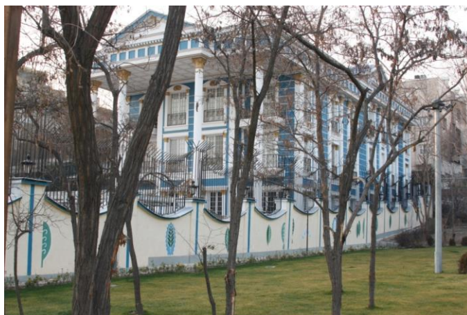
شکل ۵. منظره یکی از خانه‌های مشرف به پارک

خیابان‌های شهرک غرب است و بسیاری از خانه‌های ویلایی و گران‌قیمت در این خیابان قرار دارند. شهرک غرب نیز یکی از قسمت‌های گران‌قیمت شهر تهران است (شکل ۵).