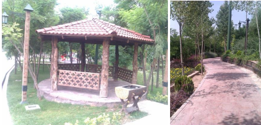
شکل ۴. مسیرهای طولی (سمت راست) و آلاچیق‌های محصور (سمت چپ)