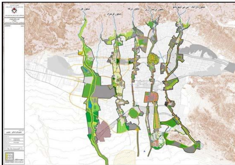
شکل ۲. پنج محور مسیل‌های شهر تهران

توجه جدی است. مسیل رود درکه از شمال به دره درکه در کوهپایه البرز و از جنوب به میدان میوه و تره بار شهر در مجاورت کمربندی آزادگان می‌رسد و از آنجا به سمت بهشت زهرا ادامه می‌یابد. براساس طرح تفصیلی شهر تهران (۱۳۸۹) رود دره اوین درکه جزء زیرپهنه‌های اصلی سبز و باز است. این پهنه مساحتی حدود ۲۱,۲۳,۶۵۹ مترمربع دارد. ضریب سکونت، صفر درصد و تعداد واحد مسکونی در آن نیز صفر است. برای این پهنه در طرح تفصیلی کاربری پارک فضای سبز در نظر گرفته شده است.