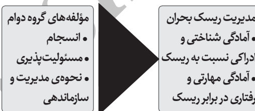
تصویر شماره‌ی ۵: مدل تحلیلی پژوهش

در این پژوهش بعد اجتماعی تاب‌آوری برای لایه‌ی گروه دوام مفهوم سازی شد و از سویی به صورت مجزا دو مفهوم ادراک ریسک و مهارت‌های مقابله با آن مورد بررسی قرار گرفت. در سطح گروهی دوام فرآیندهای شکل‌گیری و مدیریت گروه‌های داوطلب واکنش اضطراری محله و بنا بر مدل تحلیلی این پژوهش غلبه و هضم تأثیرات زلزله وابسته به قدرت یادگیری مدیریت ریسک است. برای ارتقا، محافظت و افزایش تاب‌آوری، توجه به مؤلفه‌های ذکر شده‌ی گروه دوام برای ظرفیت‌سازی ضروری است. مؤلفه‌های گروه دوام، عملکرد اجتماعی را در دوره‌ی غیربحران مد نظر قرار می‌دهند و مؤلفه‌های مربوط به مدیریت ریسک، قابلیت پاسخ‌گویی و کاهش آسیب‌پذیری را در دوره‌ی بحران می‌سنجند. تصویر شماره‌ی ۵ مدل تحلیلی پژوهش را نشان می‌دهد.