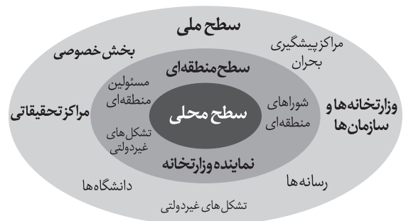
تصویر شماره ۲: سطوح کارکردی مختلف فرآیند مدیریت بحران اجتماع محور [۶]

سطح ملی: سیستم مدیریت بحران ملی کارآمد، فعالیت‌های سطوح محلی، منطقه‌ای و ملی را یکپارچه و منسجم می‌سازد. با توجه به این سطوح می‌توان تعریفی مجدد از مدیریت بحران اجتماع محور براساس سطوح کارکردی آن ارائه داد. بر این اساس مدیریت بحران اجتماع محور بر اجرای اقدامات پیشگیرانه از بحران نظیر تحلیل، تقلیل، جلوگیری و آمادگی در مقابله با بحران توسط دولت و دست‌اندرکاران محلی به‌عنوان جزئی از سیستم مدیریت بحران ملی اشاره دارد. در تصویر شماره ۲ سطوح کارکردی مختلف عناصر مدیریت بحران اجتماع محور قابل مشاهده است. [۶]