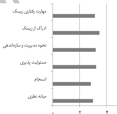
نمودار شماره ۱: میانگین شاخص‌های بررسی‌شده‌ی پژوهش در سطح گروه دوام در مقایسه با میانه‌ی نظری

همچنین همبستگی شاخص‌های بررسی‌شده‌ی سطح دوام نیز مشخص است که بنا بر جدول ضریب همبستگی به دست آمده تمامی شاخص‌ها- به جز در مورد انسجام با ادراک از ریسک و نحوه‌ی مدیریت و سازماندهی و همچنین ادراک از ریسک و مهارت رفتاری ریسک- با احتمال ۹۹٪ صحیح است که نشان‌دهنده‌ی همبستگی بالای شاخص‌های گروه دوام با مؤلفه‌های مدیریت ریسک بحران است.