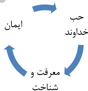
شکل ۳ - رابطه بین ایمان، محبت و معرفت

با اندک تأملی در این روابط و با دقت در مفهوم ایمان و محبت حقیقی، می‌توان ادعا کرد که هم ایمان حقیقی و هم محبت حقیقی تنها بر بستر معرفت و شناخت امکانپذیر است. در حقیقت هر چقدر شناخت و معرفت ما از جهان هستی و انسان و روابط آنها با خداوند، عمیقتر و جامعتر باشد، ایمان به خداوند و نهایتاً میل و رغبت ما به او نیز به همین نسبت بیشتر خواهد بود. از سوی دیگر هرچه ایمان ما بیشتر، تمایل به شناخت و انگیزه کسب معرفت نیز بیشتر، هم‌چنین هر چه محبت ما به حق بیشتر، تمایل به شناخت بیشتر خواهد بود. شکل ۳ نشان‌دهنده این روابط است.