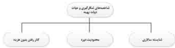
نمودار ۱: شاخصه‌های شکل‌گیری و حیات دولت بهینه

از جمله ویژگی‌های دولت بهینه، قرار گرفتن در معرض ارزیابی و قضاوت مجدد مردم در انتخابات آزاد بعدی است. روشن است دولت‌هایی که یا از طریق مجاری قانونی و سستی و یا به دلایل مشابه در عمل، از نوعی حاکمیت مادام‌العمر برخوردارند، نمی‌توانند دولت بهینه محسوب شوند. سرانجام آنکه کنار رفتن بدون هزینه حاکمان در صورت اثبات ناتوانی و یا نارضایتی اکثریت از عملکرد آنها، از دیگر شاخصه‌های دولت‌های بهینه است. نمودار ۱، شاخصه‌های شکل‌گیری و حیات دولت بهینه را نشان می‌دهد.