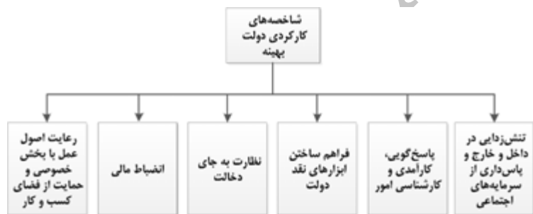
نمودار ۲: شاخصه‌های کارکردی دولت بهینه

دسته دوم از شرایط شکل‌گیری دولت بهینه فراهم بودن شاخصه‌های کارکردی تعریف شده در دوره حاکمیت دولت است که شامل نظارت دولت به جای دخالت آن در امور کسب و کار، انضباط مالی، پاسخ‌گویی و کارآمدی، پیشبرد امور براساس کارشناسی، فراهم نمودن ابزارهای نقد عملکرد حاکمان، رعایت اصول عمل در ارتباط با بخش خصوصی، تنش‌زدایی در سطوح ملی و بین‌المللی و پاس‌داری از سرمایه‌های اجتماعی است. نمودار ۲) شاخصه‌های مربوط را نشان می‌دهد: