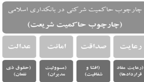
شکل ۲- چارچوب پیشنهادی حاکمیت شرکتی در بانکداری اسلامی

این چارچوب پس از جمع‌بندی اصول پیشنهادی اسلامی بر اساس مطالعات کتابخانه‌ای و همچنین استخراج اصول حاکمیت شرکتی متعارف و دسته‌بندی بر اساس روش تحلیل محتوا و تطبیق آن‌ها با اصول متعارف به دست آمد و در انتها با پرسش از خبرگان تحقیق مورد تنقیح و تایید قرار گرفت.