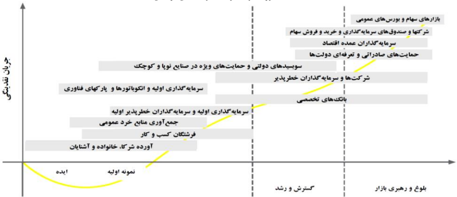
شکل ۱. روند مراحل رشد شرکت‌های تولیدی

بین می‌روند (کیمبرلی و مایلز، ۱۹۸۰). به‌منظور نشان دادن هرچه بهتر چرخه ایده تا محصول و شیوه‌های تأمین مالی مرسوم از نمودار مشهور S کمک می‌گیریم.