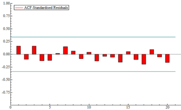
تصویر ۳. نمودار ACF اجزای خطا