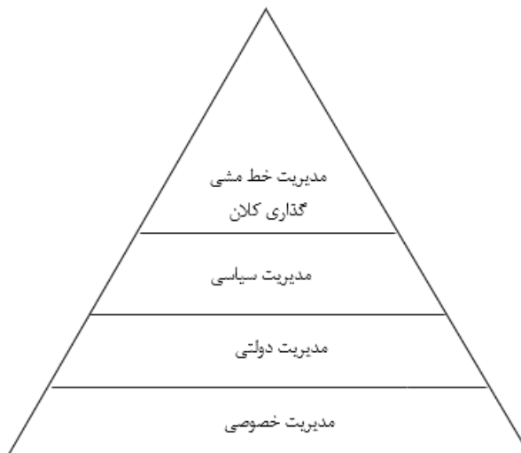
شکل ۱. سطوح مدیریت در ایران (منبع: همان)

در ایران چهار سطح برای مدیریت قائل شده‌اند که چهار سطح خط‌مشی‌گذاری را ایجاد می‌کند. این سطوح در شکل ۱ آمده است. ۱. سطح مدیریت ابرخط‌مشی‌ها که رهبری نظام و مشاوران تخصصی ایشان این وظیفه را برعهده دارند. ۲. سطح مدیریت سیاسی که برعهده قوای سه‌گانه است و خط‌مشی‌های میانی در این سطح تدوین می‌شود. ۳. سطح مدیریت اداره امور عمومی که اجراکننده خط‌مشی و مشاوره‌دهنده در تدوین خط‌مشی است. ۴. سطح مدیریت بخش خصوصی که فقط به بخش خصوصی مربوط نیست و به کلیت جامعه اشاره دارد و می‌تواند با یک مدیریت دولتی کارآ و اثربخش در جهت بهبود و رشد جامعه عمل کند (دانایی‌فرد، ۱۳۹۵، ص. ۳۸۷).