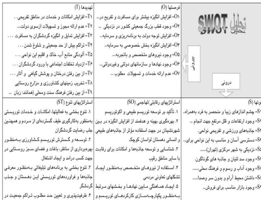
جدول ۵. راهبردهای تهاجمی و تنوع

مقایسه جایگاه کاربرد این ماتریس و نحوه استفاده در این تحقیقات: در هر دو مقاله راهبردهایی که چارچوب سوات به اذهان متبادر نموده به‌عنوان راهبرد نهایی پذیرفته شده است، در حالی که همانطور که گفته شد نمی‌توان از ماتریس سوات چنین انتظاری داشت. هنگامی می‌توان به راهبردهای بیان شده اعتماد کرد که اهداف سازمان به شفافیت بیان شده و این راهبردها در نسبت با اهداف مورد ارزیابی و اصلاح قرار گیرد. اعتبار یک راهبرد به آن است که نشان داده شود و اثبات شود که چگونه سازمان یا کشور را از نقطه فعلی به نقطه مطلوب می‌رساند و این اعتبار تنها از طریق ماتریس SWOT به اثبات نمی‌رسد.