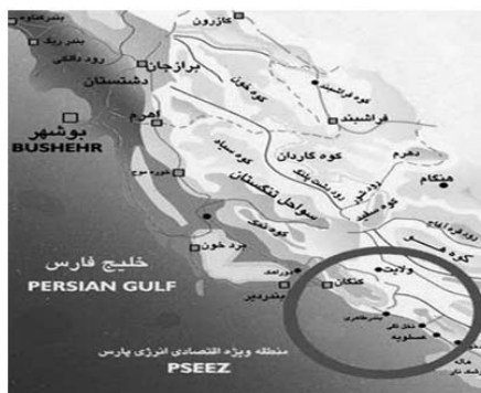
شکل ۱. محدوده منطقه مورد مطالعه

شده است. منطقه پارس جنوبی در شرق استان بوشهر در حاشیه خلیج فارس در ۳۰۰ کیلومتری شرق بندر بوشهر و در ۴۲۰ کیلومتری غرب شهرستان بندر لنگه و در ۵۷۰ کیلومتری غرب بندر عباس واقع است (شکل ۱). در کتاب «اقلیم فارس» از قول مهندس احمد حامی، نام اصلی عسلو و یا عسلویه را «اسل» به معنی آبگیر یا استخر نوشته‌اند و اینکه عسلویه حداقل در ۱۵۰۰ سال اخیر آبادی بوده است تا شهری بزرگ. در روستای عسلویه امروز شماری آب‌انبار وجود دارد که این آب‌انبارها از دید معماری جای بررسی دارند و در امتداد کوه و دریا ایجاد شده و هنوز مورد استفاده قرار می‌گیرند (طاهری، ۱۳۸۸: ۱۷۱-۱۷۰).