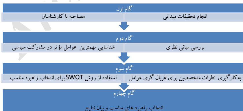
شکل ۱. فرایند انجام تحقیق

روش اس‌دبلیو‌آئی که در فارسی با نام تحلیل سوات هم شناخته می‌شود یکی از ابزارهای برنامه‌ریزی استراتژیک است که برای ارزیابی وضعیت داخلی و خارجی یک سیستم استفاده می‌شود. از این روش علاوه بر برنامه‌ریزی راهبردی به‌طور کلی در تحلیل وضعیت سازمان‌ها و سیستم‌ها استفاده می‌شود. در واقع این تحلیل را باید ابزاری کارآمد برای شناسایی شرایط محیطی و توانایی درونی بدانیم، پایه و اساس این ابزار کارآمد در مدیریت استراتژیک است. همچنین این پژوهش یک مطالعه موردی است. مطالعه موردی اختصاصاً، راهبرد مناسبی برای پاسخگویی به پرسش‌های مربوط به چگونگی و چرایی است و هدف آن تعیین عوامل و روابط میان عواملی است که بروز رفتار یا وضعیت موجود، در موارد تحت بررسی موجب شده است (حریری، ۱۳۸۵). انتخاب روش مناسب در یک پژوهش وابسته به اهدافی است که پژوهشگران مدنظر دارند. برای پاسخگویی به پرسش اصلی این پژوهش، سناریوی پژوهشی زیر طراحی شده است.