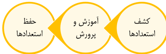
شکل ۴. الگوی حمایت از نخبگان فرهنگی شهر

به نظر می‌رسد، طراحی مسابقات، ایده خوبی برای کشف استعدادها باشد و در مرحله بعد باید برای استعدادهای شناخته شده برنامه‌ریزی کرد و فرایند آموزش و پرورش (در ادامه توضیح داده خواهد شد) را ادامه داد. به نظر می‌رسد، اجرای مرحله بعد که مرحله حفظ استعدادها است، نیاز به همکاری تمام مسئولان شهری و سازمان‌های مربوطه دارد.