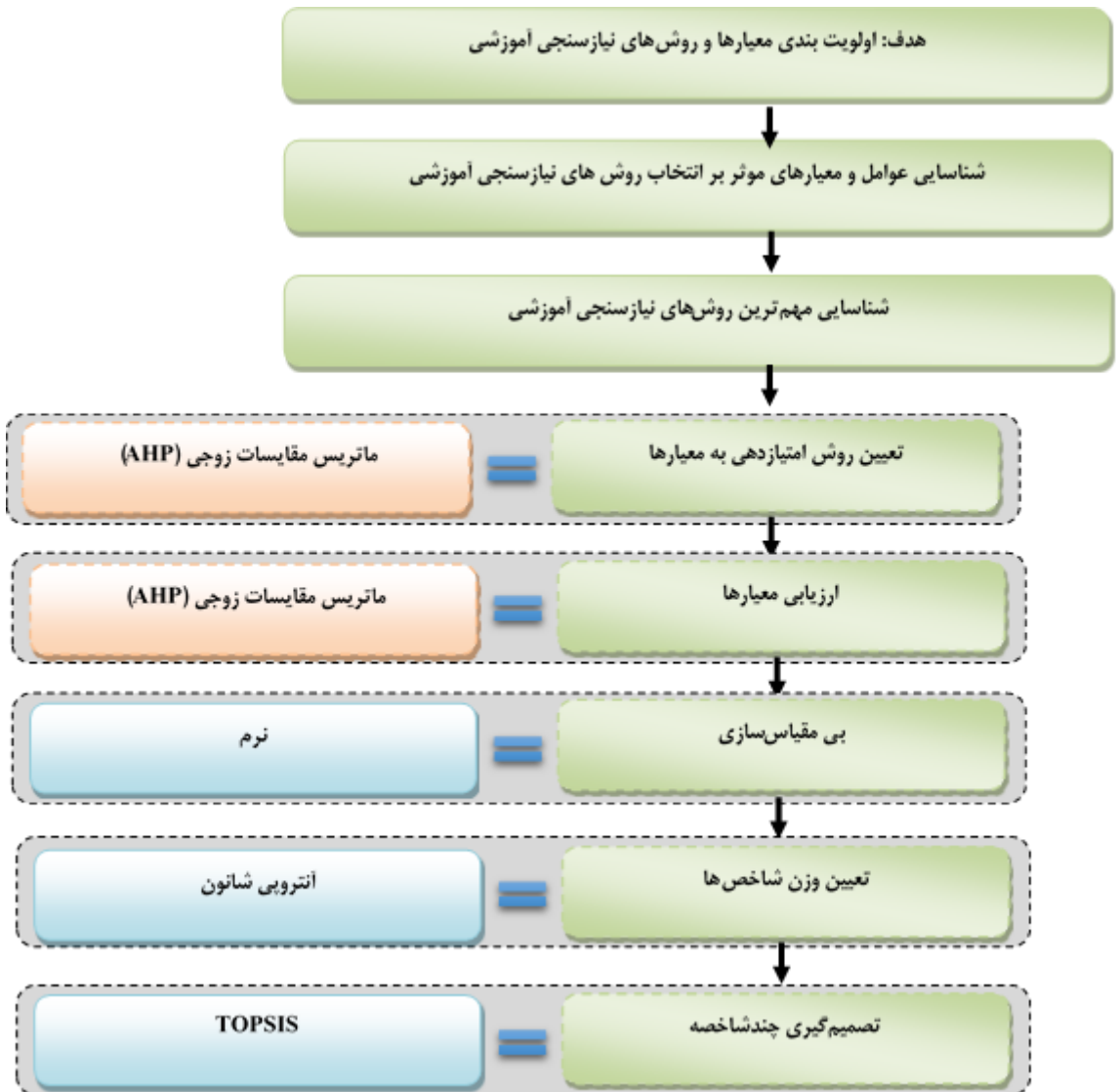
شکل ۲. فرایند کلی پژوهش