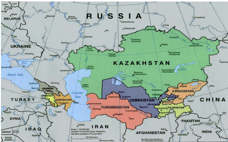
منبع: احمدی پور و دیگران، ۱۳۸۹، ص ۶۵