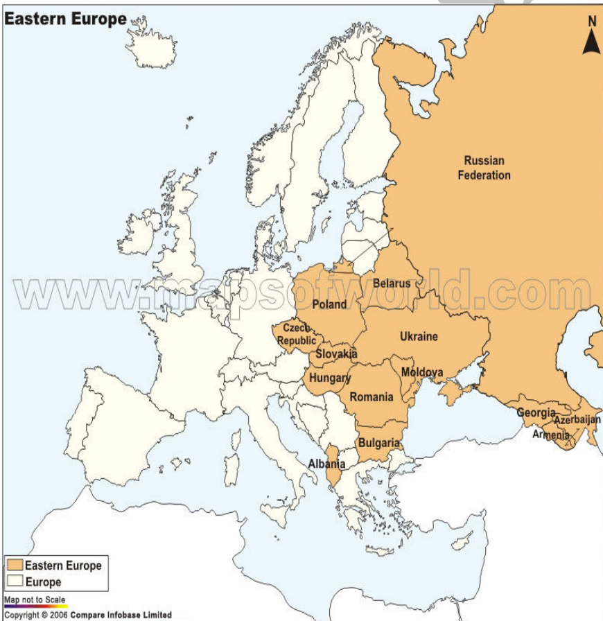
نقشه شماره ۱: نقشه سیاسی اروپای شرقی