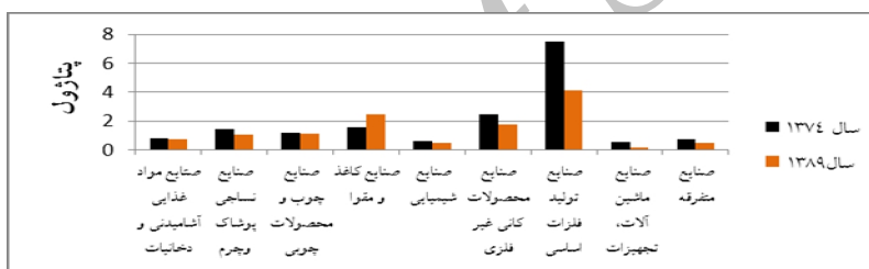
نمودار ۱. شدت انرژی در سال ۱۳۷۴ و ۱۳۸۹ در زیربخش صنعت

مربوط به فلزات اساسی، صنایع کاغذ، کانی غیرفلزی و چوب و نساجی بوده است. همانطور که مشاهده می‌شود به جز زیربخش صنایع کاغذ و مقوا، در تمامی بخش‌ها شدت انرژی کاهش داشته است. این پدیده می‌تواند نشانی از افزایش بهره‌وری در مصرف انرژی در بیشتر زیربخش‌های صنعت باشد. همچنین اطلاعات مربوط به ارزش افزوده صنایع حاکی است که زیربخش‌های چوب و کاغذ و کانی غیرفلزی که شدت انرژی نسبتاً بالایی دارند از سال ۱۳۷۴ تا ۱۳۸۹ به ترتیب دچار کاهش سهم تولیدی به میزان ۷۰ و ۶۸ و ۲۵ درصد شده‌اند و زیربخش ماشین‌آلات که شدت انرژی به نسبت پایین‌تری دارند با افزایش سهم تولیدی ۸۸ درصد مواجه بوده‌اند. با توجه به نمودار ۲ شدت انرژی در کل بخش صنعت بعد از سال ۱۳۷۸ کاهش یافته است یا روند نسبتاً ثابتی را به خود گرفته که هر دو عامل بهره‌وری و ساختار فعالیت‌های صنعتی احتمالاً در کاهش شدت انرژی بخش صنعت مؤثرند.