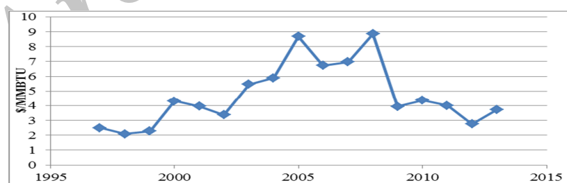
نمودار ۱. قیمت گاز طبیعی بین سالهای ۱۹۹۷ تا ۲۰۱۳ (منبع: اداره اطلاعات انرژی، ۲۰۱۴)

از آنجا که فازهای در حال بهره‌برداری پارس جنوبی می‌تواند نیاز داخلی را تامین کند، گاز تولیدی از فازهای در حال توسعه می‌تواند برای استفاده به عنوان خوراک پتروشیمی به منظور تولید محصولات با ارزش افزوده بالاتر، صادرات و یا استفاده در سایر تبدیلات گازی بکار گرفته شود که در این صورت نیز قیمت گاز باید بر مبنای قیمت‌های واقعی در نظر گرفته شود. بر این اساس از سال ۱۳۹۳ قیمت گاز تحویلی به پتروشیمی‌ها حداقل ۱۳ سنت به ازای هر متر مکعب خواهد بود و از این رو این رقم در محاسبات این تحقیق نیز مورد استفاده قرار می‌گیرد.