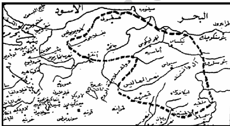
نقشه شماره ۱: محل استقرار دولت دانشمندیان در آسیای صغیر (مناطق داخل خطوط نقطه چین).

امیر احمد دانشمند پس از تصرف شهر سیواس و استقرار در این شهر، برج و باروهای این شهر را تعمیر نموده، مساجدی را در آن بنیان نهاد و این شهر را به عنوان پایگاهی درآورد که ترکان مسلمان از آنجا به اعماق نواحی داخلی آناتولی حمله می بردند. وی از همان آغاز تعدادی از سرداران دلیر و مبارز مانند سلیمان بن نعمان و یحیی بن عیسی را با خود همراه ساخته و از وجود این سرداران دلیر و نیروهای جنگجو برای رسیدن به اهداف بلند خود استفاده می کرد؛ برای نمونه یحیی بن عیسی، چندین زبان می دانست و به برکت حضور همین شخص بود که امیر احمد دانشمند می توانست میان دشمنان خود تفرقه انداخته و یا اطلاعات ارزشمندی درباره اوضاع سرزمین های مجاور با قلمرو خود به دست آورد. (القرمانی، بی تا: ۲۹۲). به این ترتیب امیر احمد دانشمند طی بیش از بیست سال حاکمیت خود بر دانشمندیان ( از ۴۷۷ تا ۵۴۹۹ ه.ق ). حملات فراوانی را به مناطق داخلی آناتولی رهبری کرد. او توانست مناطقی مانند کاپادوکیه، توقات، نیکسار، آماسیه و حتی شهرهای بندری اطراف دریای سیاه را متصرف شود. کاری که جانشینانش نیز آن را ادامه داده و قلمرو دانشمندیان را روز به روز گسترده تر ساختند (آقسرای، ۱۳۶۲: ۱۷). (نقشه شماره ۱).