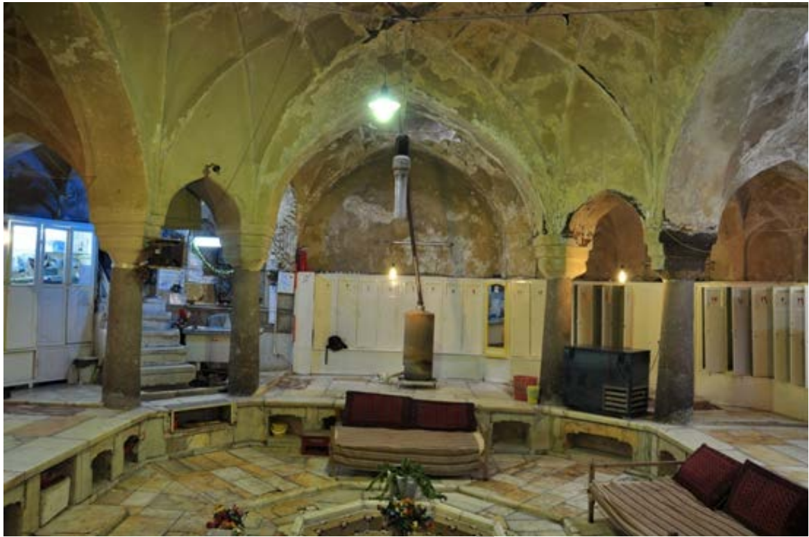
▲ عکس شماره ۷: سربینه‌ی حمام مردانه‌ی حاج محمدرحیم نگارنده، ۱۳۸۸