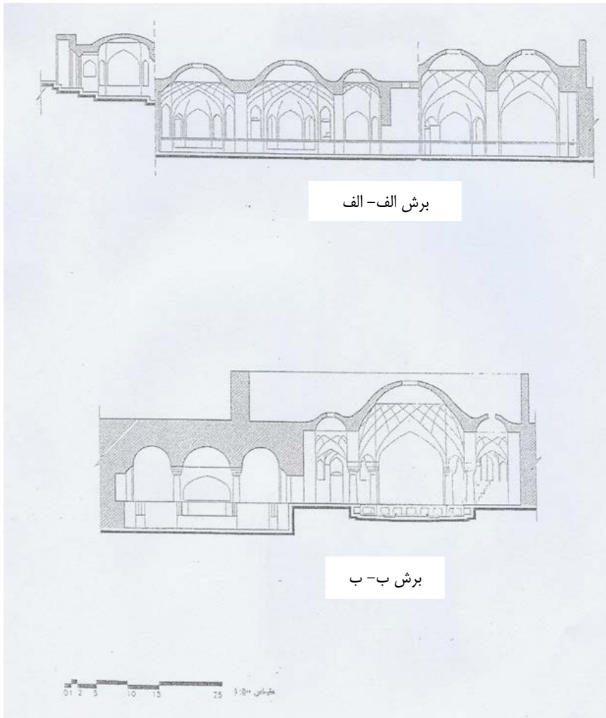
نقشه شماره ۳: برش عمودی حمام حاج محمد رحیم قزوین سازمان میراث فرهنگی و گردشگری قزوین، ۱۳۸۷. ◀