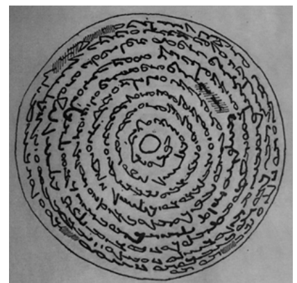
▲ تصویر ۷. طرح کشیده شده از کاسه‌ی سفالی مکشوف از منطقه‌ی خابور به خط و زبان مندایی (Pognon, 1899).

این اعتقاد وجود دارد که مهرهای اولیه، یعنی مهرهایی که متعلق به پیش از تاریخ هستند، اغلب کاربردی برای حفاظت صاحب مهر از شر ارواح پلید، دفع آفات و خطرات و مصائب داشته‌اند. نقوش درگیری حیوانات، مانند: شیر، پلنگ و گاونر، بیانگر صحنه‌ای اساطیری است که نشان از اعتقادات رایج در زمان و مکان خاص دارد. نقوشی که ذکر شد و تصاویر نمادین ایزدان و یا صور فلکی بر سطح مهر علاوه بر آن که علامت مشخصه‌ی صاحب مهر محسوب می‌گردید، به عنوان طلسمی جهت حفظ صاحب مهر از شر ارواح پلید نیز به کار می‌رفت (بیانی، ۱۳۶۳: ۱۲). در هزاره‌ی چهارم