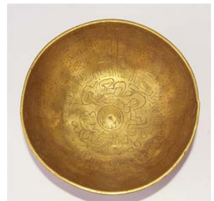
▲ تصویر ۱. کاسه‌ی «باطل سحر» از جنس فلز متعلق به دوره‌ی اسلامی.

با مطالعه‌ی متن کاسه‌های سفالین، به این مطلب پی می‌بریم که هدف برخی از آن‌ها بستن و زنجیر کردن یا دور کردن دیوانی است که نامشان به طور مکرر در میان متن‌ها ذکر شده است. آن‌ها خیلی به ندرت از زنجیر کردن و تحت فشار قرار دادن نیروهای شر صحبت می‌کنند و بیشتر به آن‌ها دستور می‌دهند که دور شوند، خانه را ترک کنند و از آزار صاحبخانه دست بکشند. تصویر دیوی که اغلب در وسط کاسه آمده است، می‌بایست ارتباطی با دیوانی که نامشان در متن آمده، داشته باشد. احتمال دارد تصویر موجود، تلفیقی از چندین دیو و در حقیقت گونه‌ی انتزاعی از نیروی شر باشد. آن‌چه در تصاویر مشترک است چهره‌هایی شبیه به انسان با بازوان دراز و انگشتانی