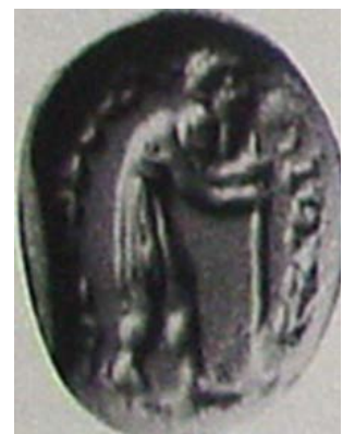
▲ تصویر ۱۲. مهر دوره‌ی ساسانی تصویر مرد خمیده‌ی عصا به دست با نوشته‌های پهلوی (Gyselen, 1995: 50).