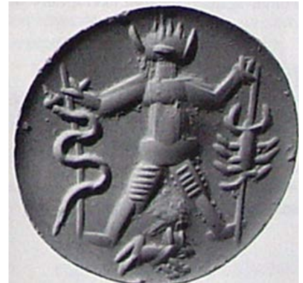
▲ تصویر ۱۰. مهر دوره‌ی ساسانی، شخصی که نقاب حیوانی بر چهره دارد و در یک سمت مار و در سمت دیگر عقرب به دست گرفته است. در پایین پا تصویر گرگی دیده می‌شود (Gyselen, 1995: 29).