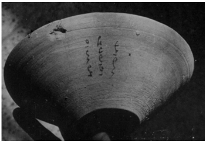
▲ تصویر ۲. کاسه‌ی سفالین پایه‌دار به‌دست آمده از منطقه‌ی شوشتر.

مشخص و با پاهایی است که به سمت بیرون کج شده و با فاصله از هم قرار گرفته‌اند؛ اغلب به زنجیر کشیده و پابند زده هستند. موهایشان آشفته و با بلندی متغیر است (Hunter, 1998: 96). در بعضی مواقع، نام دیوان و شیاطین دین‌های مختلف در متن یک کاسه ذکر شده است و چنین به نظر می‌رسد که دارنده‌ی کاسه می‌خواسته از شر تمام نیروهای اهریمنی در امان باشد.