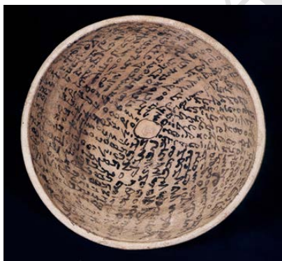
▲ تصویر ۶. کاسه‌ی سفالی مکشوف از شوشتر به زبان و خط مندایی.