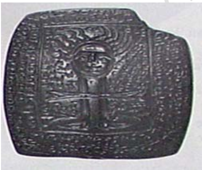
▲ تصویر ۹. مهر دوره‌ی ساسانی با نوشته‌هایی به خط فارسی میانه (Gyselen, 1995: 25).

بنابر باور پیشینیان، نیروی شر بایستی همواره در زندانی اسیر و بسته باشد تا به انسان سرایت نکند. با نگاهی به مهرها و کاسه‌های جادویی به تفاوت میان نمایش نیروی شر در آن‌ها پی می‌بریم. در مهرها این حصار به صورت زاویه‌ی قائمه نشان داده شده، خواه با یک خط ساده، خواه با یک دیواره. در کاسه‌ها نیروی شر درون حلقه‌ای قرار داده می‌شود و دست یا پای او بسته است. درون مایه‌ای که در مهرها اغلب دیده نمی‌شود (Gyselen, 1995: 76). تشخیص نیروی شر در تصاویر مهرها هنگامی که در تضاد با نیروی خیر ترسیم شده باشند، بسیار ساده‌تر است. در مهرها نیز شکل نیروی شر، انسانی است که با تغییراتی در ظاهر نمایش داده می‌شود؛ به‌عنوان مثال، بعضی از اندام بدن بزرگتر از حد معمول به تصویر کشیده می‌شود یا بعضی ویژگی‌های حیوانی، مانند شاخ و دم و غیره به آن اضافه می‌گردد (Ibid: 75).