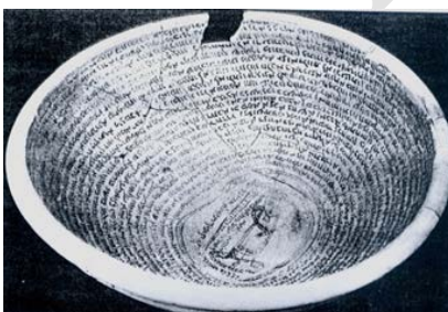
▲ تصویر ۳. کاسه سفالین به زبان آرامی دارای تصویر دیو با دست و پای ذنجیر شده (سایت موزه بریتانیا).

بیشتر کاسه‌های به‌دست آمده به زبان آرامی یهودی و بیشتر، نقل قول‌هایی از کتاب مقدس هستند. دومین زبان مورد استفاده‌ی کاسه‌ها زبان مندایی ۱۵ است که گاهی با خط مندایی و گاهی با خط عبری نوشته شده‌اند. این کاسه‌ها بیشتر در ناحیه‌ی میان‌رودان یافت شدند و نه فقط برای منداییان، بلکه برای اشخاصی با مذاهب متفاوت نوشته شده‌اند. آن‌ها به‌خاطر استفاده از تلمیح خاصی از باورهای مذهبی و ایزدان مندایی، از دیگر کاسه‌ها متمایز هستند (Shaked, 2001: 64). تعدادی کاسه نیز به خط و زبان سریانی و تعداد بسیار کمی نیز به خط پهلوی کتابی به‌دست آمده است. نوشته‌ی پهلوی روی کاسه‌ها، به نظر می‌رسد به‌وسیله‌ی زرتشتیان نوشته شده باشد. به‌طورکل حضور زرتشتی‌گری در کاسه‌های یهودی و مندایی خیلی کم است؛ گفتنی‌ست به این مفهوم نیست که هیچ ردپایی از فرهنگ و مذهب ایرانی در متن‌ها دیده نمی‌شود، بلکه زرتشتیان تمایل کمی به نشان دادن سحر و افسون از طریق نگارش این‌گونه متن‌ها دارند (Shaked, 2001: 71).