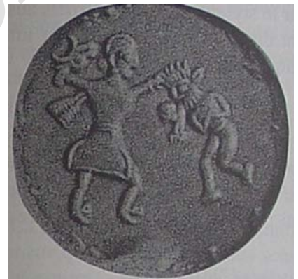
▲ تصویر ۱۱. مهر دوره‌ی ساسانی با بن‌مایه‌ی حمله‌ی نیروی خیر به نیروی شر (Gyselen, 1995: 43).