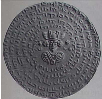
▲ تصویر ۸. مهر دوره‌ی ساسانی، تصویر شخصی درباری در وسط مهر که دور تا دور تصویر نوشته‌هایی به خط فارسی میانه دیده می‌شود. (Gyselen, 1995:27).

ق.م. آن‌ها وسیله‌ای برای تعیین مالکیت فردی محسوب می‌شدند و مهر کردن کالاها و ظروف به معنای امضاء صاحبان کالاها بوده است. گونه‌ای از مهرها در دوره‌ی ساسانیان یافت شدند که همانند مهرهای پیش از تاریخ برای هدف مشخص، یعنی حفاظت در برابر بیماری، چشم‌زخم و دور کردن شیاطین، ساخته شده بودند. طرح روی این‌گونه مهرها بن‌مایه‌های مرتبط با نیروهای شری است که باید در برابر آن‌ها حفاظت شد یا نماینده‌ی شخصیت حقیقی یا اسطوره‌ای است که برای دور کردن شر مداخله داشته است. بر روی تعدادی از آن‌ها نوشته‌ی سحرآمیز به کار رفته‌اند که ثابت می‌کنند به‌عنوان طلسم حمل می‌شده و برای مهر کردن نبوده‌اند (تصاویر ۸ و ۹). در تصویر ۹، صورتی تمام‌رخ با دست و پاهایی به شکل صلیب دیده می‌شود، نوشته‌هایی به خط فارسی میانه در فضای خالی روی مهر حک شده است که با عبارت «از ساسان به ساسان مرگ دیو، درود به تو» ۳۳ آغاز می‌گردد ۳۴ .