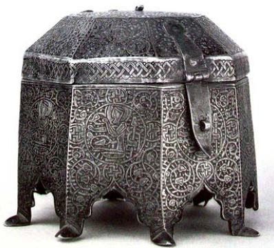
▲ تصویر ۱۲. صندوقچه‌ی برنجی هشت‌ضلعی، غرب ایران، قرن هفتم هـ.ق.، برلین، موزه‌ی هنراسلامی (Gladiss & Kroger, 1985: 320).