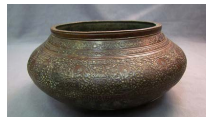
▲ تصویر ۱۵. طاس برنجی کنده‌کاری شده و نقره‌کوب، غرب ایران، قرن هفتم ه.ق. (تبریز، موزه‌ی آذربایجان، شماره‌ی ۸۱۱۸).