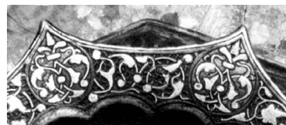
▲ تصویر ۳. گل درون ترنج‌های شانه‌ی شمعدان بوزینجرد (Melikian-Chirvani, 1982: fig. 46).