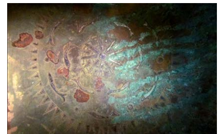
▲ تصویر ۱۶. تزیینات درون‌سوی طاس برنجی (موزه‌ی آذربایجان، شماره‌ی ۸۱۱۸).