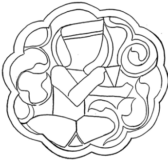
▲ تصویر ۱۱. نقش ترنج درپوش صندوقچه‌ی موزه‌ی رضا عباسی، (ترسیم: نگارنده، ۱۳۹۵).