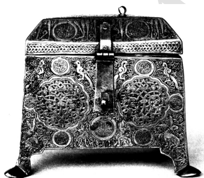
▲ تصویر ۷. صندوقچه‌ی برنجی با تزیینات کنده‌کاری شده و نقره‌کوب، غرب ایران، نیمه‌ی اول قرن هفتم هـ.ق.، لندن، موزه ویکتوریا و آلبرت (Melikian-Chirvani, 1982b, no. 82).

ریزی وجود دارد که با نظمی ماشینی به صورت سلسله‌وار چیده شده‌اند. این نقوش چنان صوری است که قوس‌های پیچک‌ها را به چرخ‌دنده شبیه کرده است. این شاخه‌های بی‌روح، تفاوت بسیاری با شاخه‌های نوک خمیده پیچک‌های خراسانی دارد (Melikian-Chirvani, 1982: 181) و می‌تواند دلیلی بر ساخته شدن این اثر در یک کارگاه غیر خراسانی باشد.