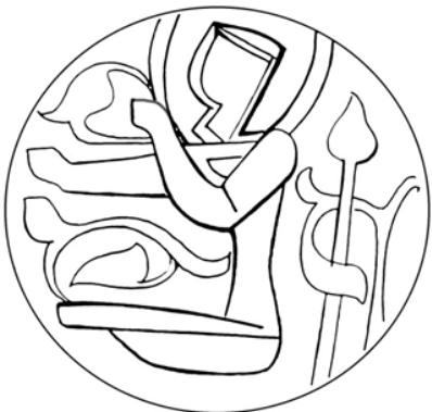
▲ تصویر ۱۳. پیکره‌ی دوزانو نشسته‌ی صندوقچه برلین (ترسیم: نگارنده، ۱۳۹۵).

خاص، بعدها در پیکرنگاری آثار فلزی این دوره، محبوبیت بسیاری به دست آورده است (تصویر ۱۱). به طور کلی، مقایسه‌ی اجمالی سبک پیکره‌های این صندوقچه با پیکره‌های به کاررفته در آثار متقدمی چون شمعدان بوزینجرد، نشان از یک تغییر در بیان هنری می‌دهد. فلزکاران این دوره، زبان هنری متعلق به ماده‌ی خود را پیدا کرده و از شمایل‌نگاری خاص سفالینه‌های منقوش فاصله گرفته‌اند.