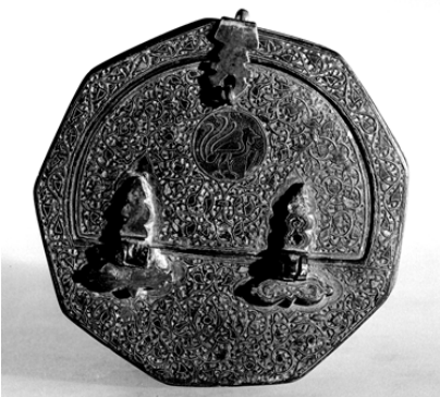
▲ تصویر ۵. دخل مفرغی کنده‌کاری شده و نقره‌کوب، گنجینه‌ی بوزینجرد، نیمه‌ی اول قرن هفتم هـ.ق. (تهران، موزه ملی ایران، شماره‌ی ۳۵۲۸).