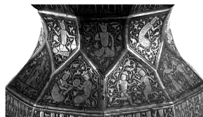
▲ تصویر ۲. بخشی از تزیینات شمعدان بوزینجرد، نیمه‌ی اول قرن هفتم ه.ق. (تهران، موزه‌ی ملی ایران، شماره‌ی ۳۵۲۶).

وابستگی سبک شناختی دخل بوزینجرد، به‌ویژه بدنه‌ی استوانه‌ای آن، به سنت فلزکاری شمال شرق ایران آشکار است؛ با وجود این، تزیینات درپوش مسطح آن مرز این اثر را با تولیدات مکتب خراسان برجسته کرده است (تصویر ۶). تزیینات این بخش از دخل، به پیروی از شکل درپوش آن، به دو نیم‌دایره و یک حاشیه‌ی باریک تقسیم شده است. غیر از یک دایره‌ی کوچک بر روی درپوش که حاوی نقش خروس است، دیگر قسمت‌های فضای موجود با نقوش اسلیمی متشکل از پیچک‌هایی با برگ‌های لوزی‌شکل، پوشانده شده است. روی پیچک‌ها، شاخه‌های بسیار