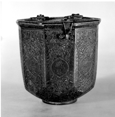
▲ تصویر ۵. دخل مفرغی کنده‌کاری شده و نقره‌کوب، گنجینه‌ی بوزینجرد، نیمه‌ی اول قرن هفتم هـ.ق. (تهران، موزه ملی ایران، شماره‌ی ۳۵۲۸).