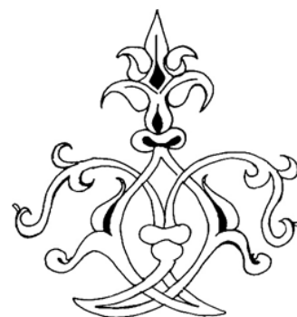
▲ تصویر ۴. طرح خطی گل اسلیمی محراب کاشی، قم، قرن هشتم ه.ق. (ترسیم: نگارنده؛ براساس کیانی، ۱۳۷۶: ۱۳۸).