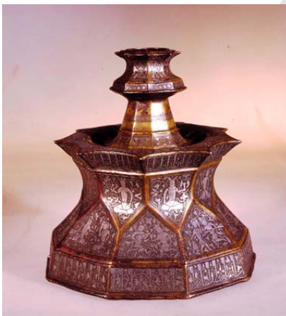
▲ تصویر ۱. شمعدان مفرغی نه‌وجهی با تزیینات نقره‌کوب، بوزینجرد، نیمه‌ی اول قرن هفتم هـ.ق. (تهران، موزه‌ی ملی ایران، شماره‌ی ۳۵۲۶).

با وجود آن‌که ویژگی‌های سبک‌شناختی این شمعدان تفاوت بسیاری با آثار فلزکاری خراسان دارد، برخی از محققان گمان برده‌اند که این اثر از تولیدات آن مکتب و متعلق به دوره‌ی پیش از مغول است (ن.ک. به: Dimand, 1950: fig. 149؛ نوروزی طلب و افروغ، ۱۳۸۹: ۱۱۷، تصویر ۲). وابستگی ساختار کلی شکل آن به فلزکاری خراسان،