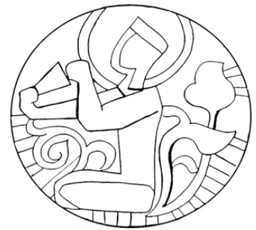
▲ تصویر ۱۴. پیکره‌ی دوزانو نشسته‌ی طاس تبریز (ترسیم: نگارنده، ۱۳۹۵).

می‌رود فلزکاران از الگوهای کلیشه‌ای خاصی برای ساختن آن‌ها بهره گرفته‌اند. همین نحوه‌ی برخورد را می‌توان در شیوه‌ی ترسیم نقوش گیاهی این اثر نیز مشاهده کرد. در واقع، کل نقوشی که در سطح این طاس برنجی به‌کاررفته از یک شیوه‌ی صنعتی و ماشینی پیروی می‌کند. این شیوه را می‌توان مهم‌ترین ویژگی مکتبی دانست که بعد از هجوم مغول در فلزکاری ایرانی شکل گرفته است.