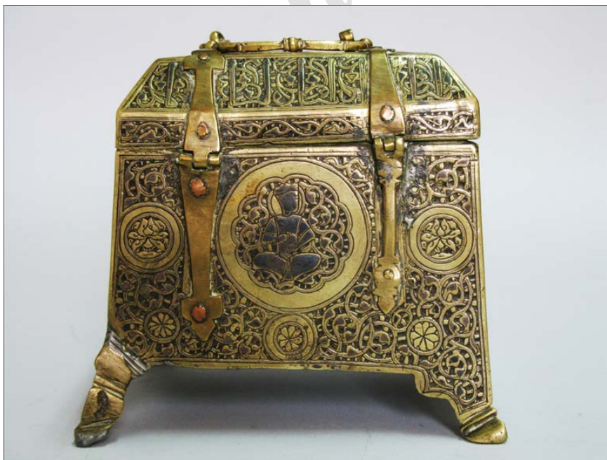
تصویر ۱۰. صندوقچه‌ی برنجی کنده‌کاری شده و نقره‌کوب، غرب ایران، قرن هفتم هـ.ق. (تهران، موزه‌ی رضا عباسی، شماره‌ی ۴۳۸).