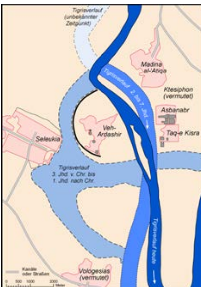
▲ شکل ۳. تصویر و نقشه‌ی شهر سلوکیه در ساحل رود دجله (https://en.wikipedia.org/wiki/Ctesiphon).

زمین‌های شاهی بسیار وسیع بودند و بیشتر زمین‌های کشور جزو این زمین‌ها به حساب می‌آمدند؛ نصف این زمین‌های شاهی را روستاییان کشت و زرع می‌کردند و مجبور بودند که مالیات نقدی و جنسی در قبال آن به پادشاه بپردازند. وضع کشاورزانی