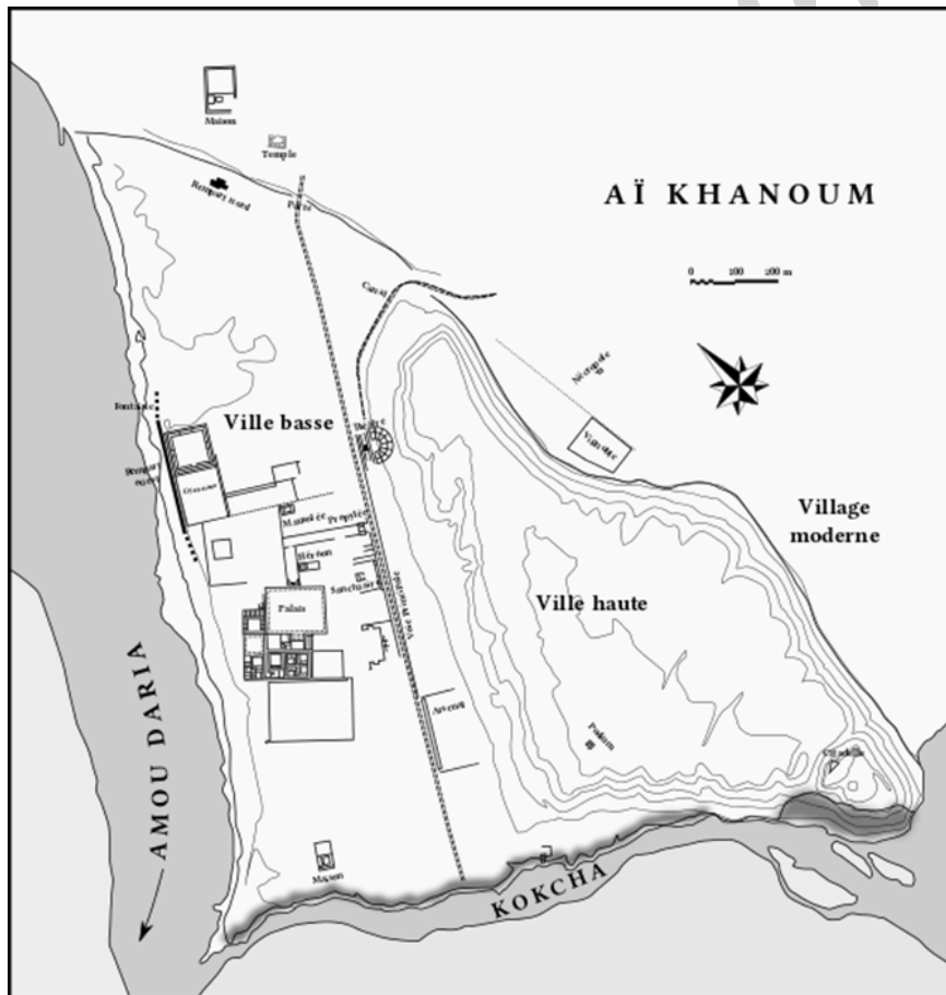
شکل ۴. پلان شهر سلوکی آی خانوم (// http://www.civilization.org.uk/wp-content/uploads/Ay-Khanum-map.jpg)

اجدادی خود را حفظ کرد و معتقدات فرهنگی، اجتماعی و از همه مهم تر، مذهبی خود را ادامه داد (گیرشمن، ۱۳۷۲: ۲۸۳). مشرق به مغرب نزدیک نگردید، هرچند در ابتدا مغرب، چندی بر مشرق برتری یافت تا پارت ها روی کار آمدند و پس از آن مشرق قدیم به دو بخش تقسیم شد؛ در قسمت غربی تا فرات و در قسمت شرقی به واسطه ی زوال سلطه ی یونانیان، هلنیسم سست و زائل شد و غربیان در میان شرقیان منحل گردیدند (پیرنیا، ۱۳۴۵: ۲۱۱۹). هر چند تمدن هلنی در شهرهایی که به وسیله ی سلوکیان احداث شده بود، وارد گردید؛ ولی در اوضاع رعایا و طبقات پایین جامعه، مانند روستاییان و کشاورزان تأثیر چندانی نگذاشت و حتی تأثیر کمی که بر افراد نزدیک به میدان های جنگ و داخل این شهرها گذاشت، به تدریج کم رنگ شده و تنها اثرات کمی از آن برجای ماند (سایکس، ۱۳۴۳: ۴۰۶). با توجه به مشکلاتی که در نیمه ی دوم عمر سلوکیان به ویژه در سرزمین های شرقی پیش آمد، جریان پیاده کردن و گسترش یونانیت در شرق دچار سستی گردید. البته سلوکیان در ایران و در مسیر جاده ی خراسان (ابریشم) و شمال ایران، از جمله در باختر به مدت نیم قرن موفقیت هایی را تجربه کردند. همین وضع در آسیای غربی نیز به وجود آمد و شهرهای یونانی-مقدونی احداث شده که دارای جمعیت زیادی از یونانیان بودند با انحطاط و انقراض دولت سلوکی ضعیف گشته و در ایران به تابعیت دولت پارت و در سوریه و آسیای صغیر و