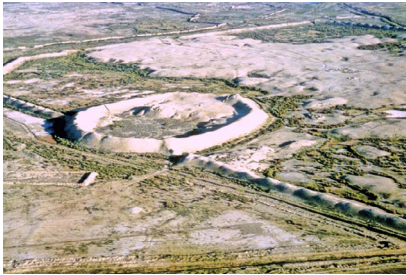
▲ شکل ۱. عکسی از شهر مرو با پلان منظم چهارگوش در ترکمنستان به‌عنوان یکی از شهرهای سلوکی (https://en.wikipedia.org/wiki/Merv).