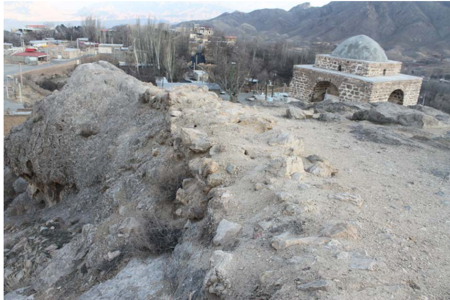
► تصویر ۱۰. بقایای دیوار ضلع شمالی محوطه (نگارنده، ۱۳۹۶).