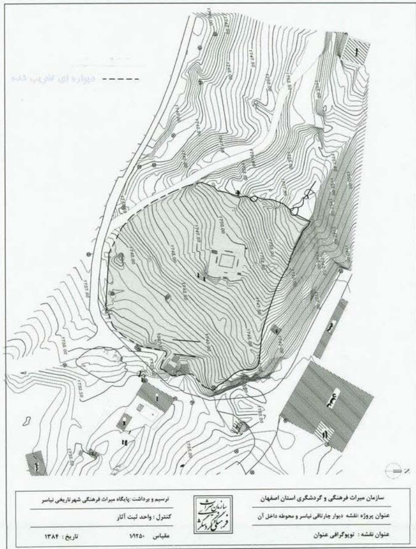
تصویر ۹. نقشه توپوگرافی چهارتاقی نیاسر (پایگاه نیاسر ۱۳۸۴). ◀

است. حجم متراکم ساختار معماری در محوطه‌ی غربی چهارتاقی نشان‌دهنده‌ی تأسیسات احتمالی وابسته به چهارتاقی است. به‌باور کلایس در دیوار ضلع غربی دو برج وجود دارد، اما توضیحی درباره‌ی آن‌ها نمی‌دهد. او هم‌چنین در فاصله‌ی ۳۰ متری شمال غربی مجموعه و روی صخره‌ها به بقایای یک ساختمان سه اتاقه اشاره می‌کند (Kleiss, 1989: 665). در حال حاضر چنین ساختارهایی قابل مشاهده نیست. از دیوار شمالی-جنوبی شرق محوطه، تنها بقایای اندکی از یک پشته‌ی کوچک به طول ۱۱ متر، عرض ۷ متر و ارتفاعی در حدود ۱ متر در جنوب چشمه‌ی اسکندریه دیده می‌شود. احتمال می‌رود چهار دیوار ناقص مزبور، محوطه‌ی چهارتاقی را محصور می‌کرده است. شناسایی دقیق وضعیت دیوارها و پی‌بردن به زمان ساخت آن‌ها، نیازمند کاوش‌های باستان‌شناختی و عملیات پی‌گردی است. در شمال غربی محوطه‌ی چهارتاقی، انبوه وسیعی از توده‌های سنگ به چشم