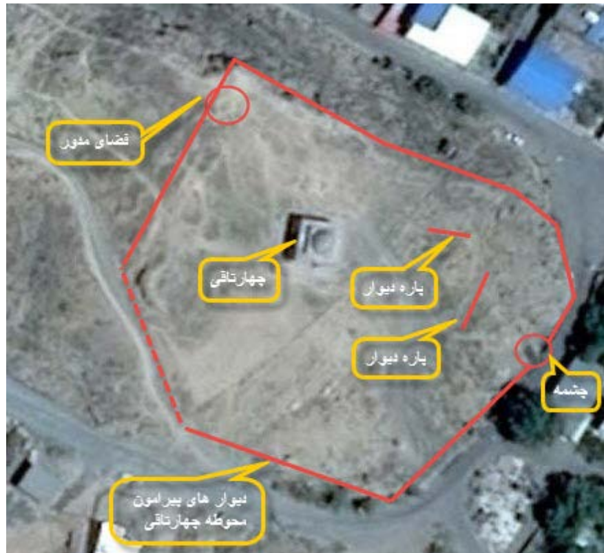
► تصویر ۸. بقایای معماری محوطه چهارتاقی.

در سال ۱۳۸۴ دیوارهای محوطه چهارتاقی در فهرست آثار ملی به ثبت رسیده است، اما گزارش ثبتی آن فاقد توصیف فنی و دقیق از ساختار دیوارها و برداشت از وضعیت دیوارهای باقی مانده محوطه است (پیراینده و همکاران، ۱۳۸۴). بقایای پاره دیوارهای محوطه‌ی چهارتاقی، شامل چهار دیوار در محور شرقی-غربی و شمالی-جنوبی محوطه‌ی چهارتاقی است که احتمال می‌رود محوطه را محصور می‌کرده است. این دیوارها از سنگ و ملات گل ساخته شده‌اند. نمای خارجی آن با لاشه‌سنگ‌های کوچک و بزرگ چیده شده و فضای میانی آن‌ها با قطعات سنگ‌های کوچکتر پر شده است. آثار دیوار شرقی-غربی شمال محوطه (تصویر ۱۰) در فاصله‌ی ۵ متری شمال چهارتاقی، به طول ۸۰ متر، عرض ۱ متر و بلندی (باقی مانده) ۴۰ سانتی متر، بریال صخره ساخته شده است. آثاری از تراش و تسطیح بستر صخره‌ای در امتداد دیوارها بریال شمال غربی محوطه‌ی چهارتاقی دیده می‌شود. از دیوار شرقی-غربی در جنوب محوطه‌ی چهارتاقی، بقایای کمتری به صورت پشته‌ی کم‌ارتفاعی نزدیک به ۱ متر باقی مانده است و ساختار مشخصی را نشان نمی‌دهد. طول آن ۱۳ متر و عرض آن به حدود ۶ متر می‌رسد. دیوار شمالی-جنوبی که در غرب محوطه‌ی چهارتاقی و به فاصله‌ی ۳۰ متری از آن ساخته شده، به صورت پشته‌ی انبوهی از لاشه‌سنگ‌های کوچک و بزرگ به طول ۷۴ متر و عرض ۱۰ متر نمایان است. متوسط ارتفاع این پشته نسبت به جنوب محوطه ۳ متر است و ساختار به هم ریخته‌ای را نشان می‌دهد. بخش‌هایی از آن تخریب و خاک‌برداری شده