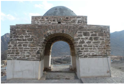
▲ تصویر ۳. نمای شمالی چهارتاقی نیاسر (نگارنده، ۱۳۹۶).

۴۳۰ سانتی‌متر افزایش یافته است. در نهایت تا رأس تاق، دهانه کوتاه‌تر شده و به ۳۳۰ سانتی‌متر می‌رسد. ارتفاع کلی درگاه نیز به ۵۵۰ سانتی‌متر می‌رسد. هم‌چنین در مرکز نمای داخلی جرز شمال غربی، تاقچه کوچکی تعبیه شده است. بر بالای چهارتاق، بخش انتقالی گنبد و در واقع حلقه‌ی اتصال جرزها به گنبد قرار گرفته است (تصویر ۳).