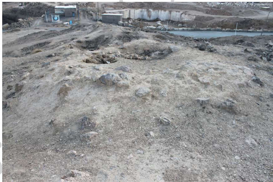
► تصویر ۱۱. بقایای فضای مدور ضلع غربی محوطه.

می‌خورد که ساختاری مدوری را به قطر ۷ متر نشان می‌دهد (تصویر ۱۱). این ساختار معماری در راستای دیوار شمالی جنوبی ضلع غربی محوطه‌ی چهارتاقی قرار دارد و احتمالاً به آن متصل است. هم‌چنین آثاری از بقایای معماری در محوطه‌ی شرقی چهارتاقی دیده می‌شود. در سال ۱۳۴۵، مشکوتی تصویری از چهارتاقی نیاسر به چاپ رسانده است که در آن شواهدی از یک سازه‌ی سنگ‌چین در محوطه‌ی شرقی چهارتاقی دیده می‌شود (مشکوتی، ۱۳۵۴: ۱۰) اما امروزه اثری از آن وجود ندارد.