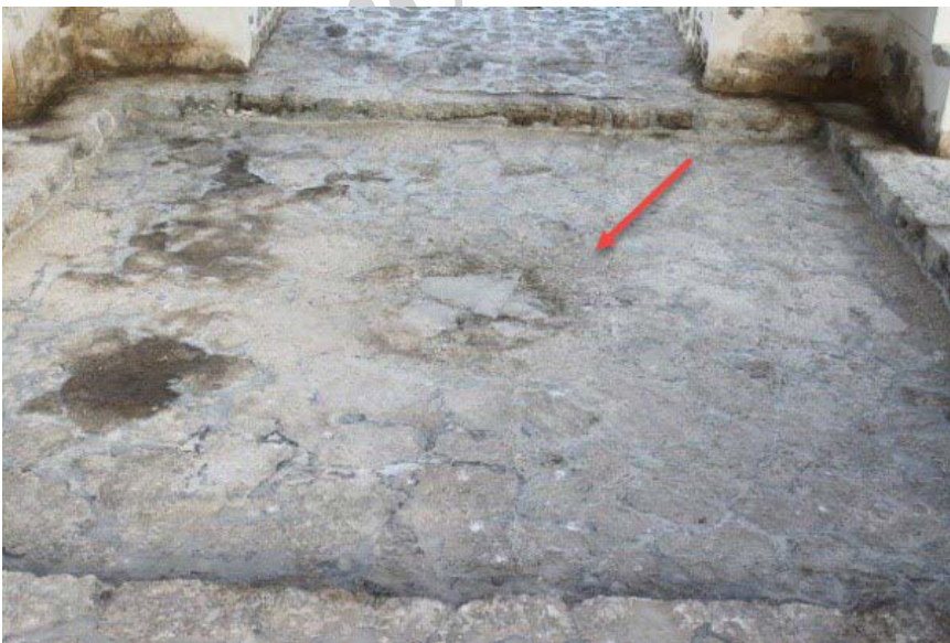
تصویر ۷. فضای مرکزی چهارتاقی و محل آتشدان (نگارنده، ۱۳۹۶). ◀