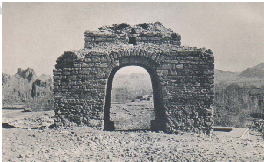
► تصویر ۵. نمای غربی چهارتاقی قبل از مرمت (هاردی، ۱۳۷۱: تصویر ۱۰۳).