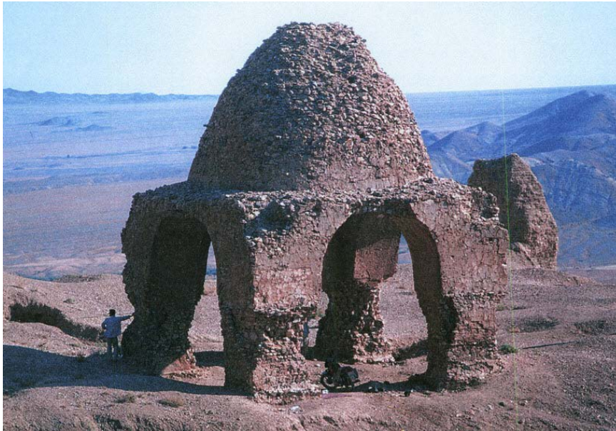
تصویر ۱۴. چهارتاقی شیرکوه (شاه‌حسینی)، (۱۳۸۱). ◀

دیگر آن‌ها، چنان‌که پیش‌تر نیز اشاره شد، شباهت شکل قوس بیضی و تاق درگاه چهارتاقی‌های پیش‌گفته با چهارتاقی نیاسر است. این تاق‌ها بدون استفاده از قالب ساخته شدند، به طوری‌که به تدریج از عرض دهانه‌ی آن‌ها کاسته و به سمت داخل متمایل می‌شدند تا در نهایت در رأس تاق به هم نزدیک و پوشانده شده‌اند. پاکار قوس‌ها نیز کمی پیش‌آمدگی دارند. این تکنیک تاق‌زنی هم در نمونه‌های آغازین و هم در بناهای پایانی دوره‌ی ساسانی به‌کاررفته است.