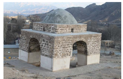
▲ تصویر ۲. مسدود شدن ورودی شمالی و غربی چهارتاقی نیاسر (نگارنده، ۱۳۹۶).

ارتفاع سکوه‌های ایجاد شده در این ورودی‌ها، بین ۸۵ تا ۱۰۵ سانتی‌متر است. به نظر می‌رسد سکوبندی، مربوط به عملیات مرمت بنا در سال ۱۳۳۴ ه.ش. و برای جلوگیری از ورود نزولات جوی به داخل چهارتاقی صورت گرفته باشد. در حفاصل جرزها، ورودی‌های متقارنی در چهار جهت اصلی ایجاد شده است که نسبت به کف بیرونی چهارتاقی، ۱۷ سانتی‌متر بالاتر است. از این رو پلان کف بنا، تشکیل یک فضای چلیپا را می‌دهد که از شکل‌های متداول آتشکده‌های ساسانی است. عرض ورودی‌ها تا ارتفاع ۶۵ سانتی‌متری، ۳۵ سانتی‌متر است. از این کد ارتفاعی (سکوپی که پایه‌های چهارتاقی را در میان گرفته‌اند) ورودی‌ها عریض‌تر شده و به