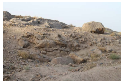
▲ تصویر ۱۲. بقایای دیوار در محوطه‌ی شرقی چهارتاقی.

تراش‌خورده و در قسمت بالای دیوار از لاشه‌سنگ‌های کوچک و بزرگ استفاده شده است (تصویر ۱۲). هم‌چنین در فاصله‌ی ۸ متری جنوب این دیوار و ۳۸ متری شرق چهارتاقی، بقایایی از یک دیوار سنگی به طول ۱۲ متر، به صورت پشته‌ای از قلوه‌سنگ‌های کوچک و بزرگ در راستای شمالی-جنوبی نمایان است که ساختار آن چندان مشخص نیست. این دیوار تا چشمه‌ی پایین دست آن ۱۴ متر فاصله دارد. این سازه در عکسی که گذار از جبهه‌ی شرقی محوطه‌ی چهارتاقی گرفته است، نمود بهتری دارد.