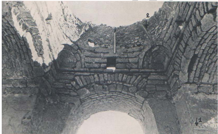
► تصویر ۴. فضای داخل چهارتاقی قبل از مرمت (هاردی، ۱۳۷۱: تصویر ۱۰۵).

بخش انتقالی از بیرون بنا به شکل دیوار چهارگوش و در میانه‌ی هر ضلع آن دریچه یا پنجره‌ی کوچکی به شکل مستطیل و به ابعاد ۶۰×۴۰ سانتی‌متر برای عبور نور و تهویه تعبیه شده است. در زوایای داخلی و در جایی که نیروی گنبد به جرزها انتقال می‌یابد، گوشواره‌ها تعبیه شده‌اند (تصویر ۴). گوشواره‌ها، فضای چهارگوش را به تدریج به دایره تبدیل کرده‌اند. متأسفانه گنبدی که برفراز چهارتاقی قرار داشته