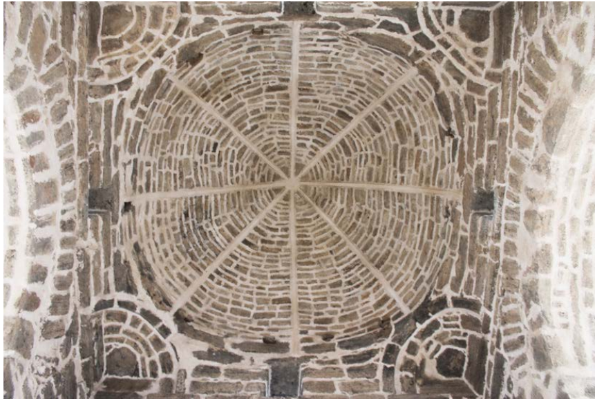
تصویر ۶. فضای داخل چهارتاقی بعد از مرمت. ◀

در گذشته فرو ریخته است. از زمان تخریب آن آگاهی چندانی وجود ندارد و اطلاعات متناقضی در دست است. ظاهراً بنا بر گزارش نویسنده‌ی تاریخ کاشان، چهارتاقی تا دوره‌ی ناصری بدون خرابی و برپا بوده است (کلانتر ضرابی، ۱۳۷۸: ۸۹). از سوی دیگر نویسنده‌ی قم نامه بر پایه‌ی رسالات دوره‌ی ناصری اشاره دارد، قدری از سقف چهارتاقی خراب شده و مابقی برجاست (مدرسی طباطبایی، ۱۳۶۴: ۳۰۷). به نظر هاردی با توجه به بقایای قوس آن، گنبدی خاگی ۳ شبیه گنبد فیروزآباد داشته است (هاردی، ۱۳۷۱: ۱۵۲). پوپ نیز بر شلجمی بودن گنبد تأکید می‌کند (پوپ، ۱۳۷۳: ۷۱). در تصاویر مربوط به قبل از بازسازی گنبد، شواهدی از چندین رج لاشه‌سنگ‌های باقی مانده‌ی گنبد و روزنه‌های کوچک چهارگوش دیده می‌شود (تصویر ۵). متأسفانه در بازسازی غیراصولی گنبد که در سال ۱۳۳۴ ه.ش. توسط