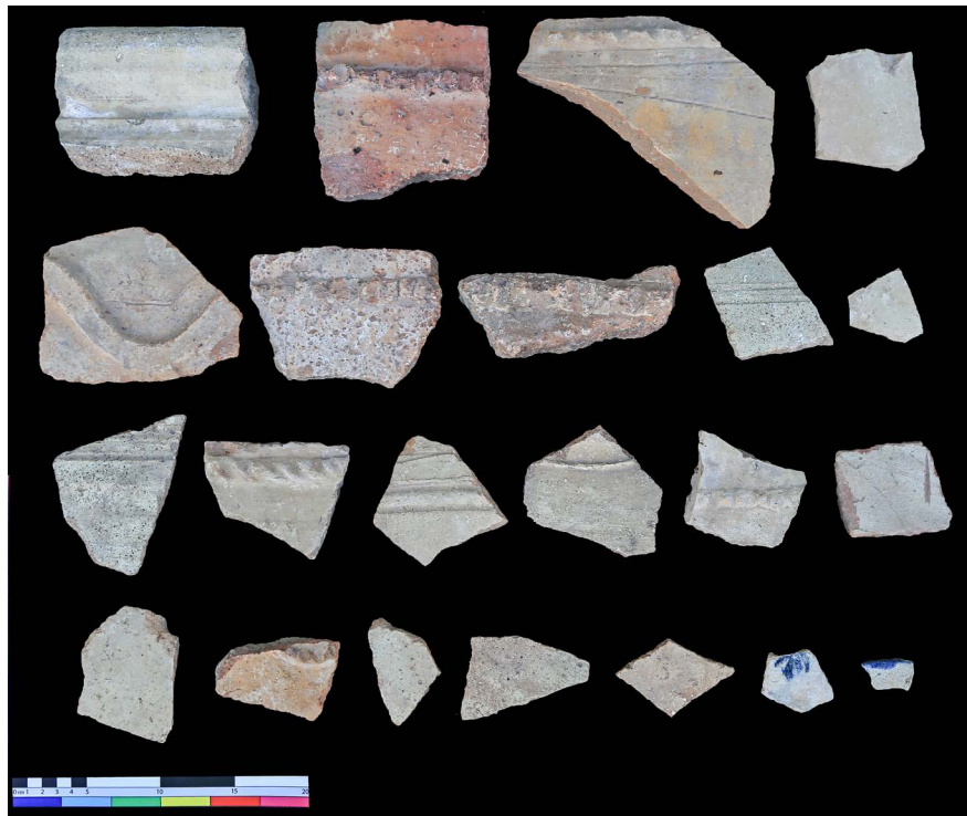
► تصویر ۱۳. سفال‌های سطحی محوطه چهارتاقی (نگارنده، ۱۳۹۶).