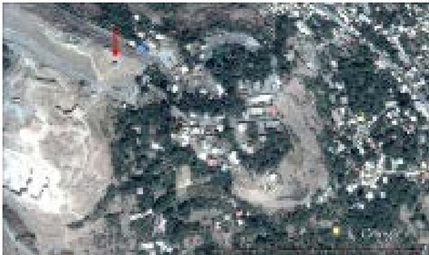
تصویر ۱. موقعیت ماهواره‌ای چهارتاقی در بافت شهری نیاسر. ◀