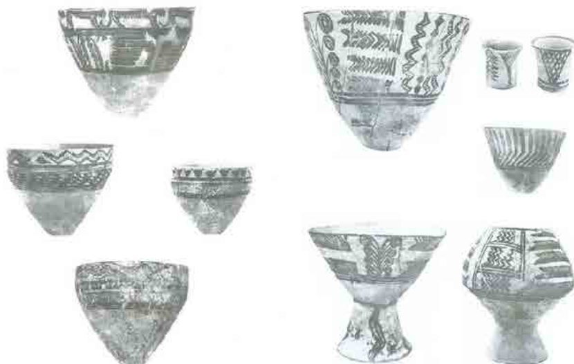
► شکل ۷. سفال سیلک III، تپه سیلک (گیرشمن، ۱۳۷۹: ۱۸۸، لوح ۱۲: ۱۹۱، لوح ۱۵).

مرکزی پیچیدگی‌های فناورانه‌ای به وقوع پیوست و بسترهای مناسبی برای بروز تحولات جدید در دوره‌ی سیلک 5-III4 فراهم گردید.