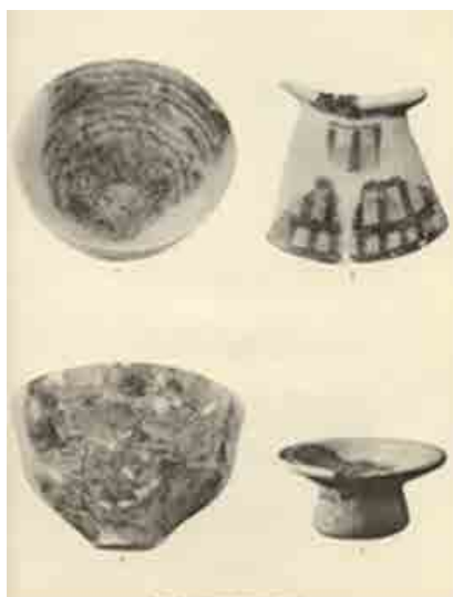
▲ شکل ۲. سفال دوره‌ی I سیلک (گیرشمن، ۱۳۷۹: ۱۸۰).