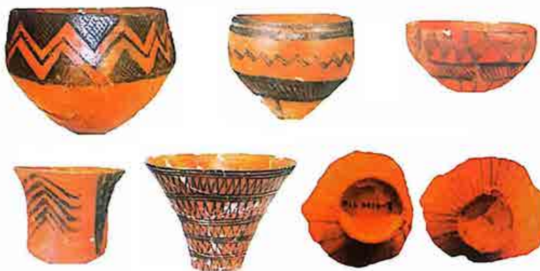
شکل ۴. سفال دوره‌ی مس‌وسنگ انتقالی، تپه چشمه‌علی (ملک شه‌میرزادی، ۱۳۹۰: ۹۷).

سفال نخودی منقوش سیلک I در اواخر هزاره‌ی ششم قبل از میلاد دگرگون شد و در دوره‌ی سیلک II به صورت سفال قرمز و قرمز آجری (نوع چشمه‌علی) تولید گردید. ظرافت، کیفیت پخت مناسب، تعدد شاموت‌ها، تنوع نقش مایه‌ها (نقوش هندسی، گیاهی، حیوانی و انسانی) و گوناگونی فرم‌ها، از جمله ویژگی‌های این سفال است که برای اولین بار در محوطه‌ی چشمه‌علی شناخته شد و در سیلک II مورد بازشناسی قرار گرفت (شکل ۴). این سفال در چشمه‌علی در طول دوره‌ی مس‌وسنگ انتقالی در مقیاس بالا و در اشکال مختلف و با کیفیت بسیار بهتری نسبت به دوره‌ی قبل تولید می‌شود (Fazeli Nashly, 2001: 132).