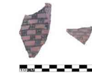
▲ شکل ۳. قطعات سفال نوسنگی تپه پردیس، دشت تهران، الف (گروه اول؛ ب) گروه دوم؛ ج) گروه سوم (ولی‌پور، ۱۳۹۴).