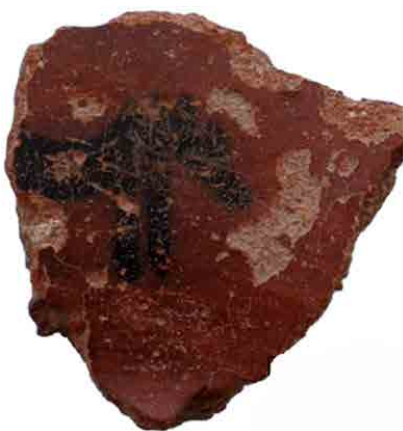
▲ شکل ۶. سفال آلویی، آق تپه کرج (رحیمی، ۱۳۹۴: ۱۱۴).

سفال چشمه‌علی در لایه‌های اولیه‌ی سیلک II، از لحاظ فنی و تزئینی دارای کیفیت بالایی نبود، ولی ویژگی‌های تکنیکی و زیبایی‌شناختی آن در لایه‌های بالایی (اندکی پس از آغاز هزاره‌ی پنجم قبل از میلاد) ارتقا یافت. گویا در همین دوره است که ساکنان تپه‌ی شمالی سیلک، این محل را در بازه‌ی زمانی ۴۹۶۰ تا ۴۷۲۰ ق. م. به دلیل شرایط نامطلوب اقلیمی و خشک‌سالی ترک کردند (فاضلی‌نشلی، ۱۳۹۰: ۱۲). سپس بعد از آن، در نیمه‌ی هزاره‌ی پنجم قبل از میلاد، استقرار در سیلک و در محل تپه جنوبی ادامه می‌یابد و از این زمان به بعد، دوره‌ی III در تپه سیلک آغاز گردید. از نیمه‌ی هزاره‌ی پنجم قبل از میلاد، تپه زاغه نیز در تاریخی بین ۴۴۶۰ تا ۴۲۴۰ ق. م.، متروک شد و تپه قبرستان به عنوان یک مرکز صنعتی در زمینه‌ی فلزگری و سفالگری مسکون شد (فاضلی‌نشلی، ۱۳۸۵: ۸۵ و ۳۵). در لایه‌های تحتانی قبرستان که در گاهنگاری یوسف مجیدزاده در دوره‌ی فلات میانی قرار می‌گیرند (Majidzadeh, 1976) و با سیلک III-3 همزمان هستند، نوعی سفال ارغوانی تیره مشاهده شد که به «سفال آلویی» معروف گردید (شکل ۶). مجیدزاده صاحبان این سفال را مهاجمانی می‌داند که به فلات مرکزی وارد و باعث متروک شدن