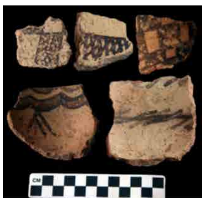
▲ شکل ۱. قطعات سفالی چهاربند، دشت قزوین (Fazeli Nashli et al., 2013: 136).

سفال‌های نوسنگی تپه پردیس در سه گروه: ساده‌ی خشن با پوشش نخودی، منقوش نخودی و منقوش متمایل به قرمز قرار می‌گیرند (شکل ۳). سفال گروه اول، از نوع: پوک، خشن و نیمه‌خشن، و دارای حرارت نامناسب و شاموت گیاهی است. در گروه دوم، سفال‌های به نسبت ظریف‌تر، منقوش (با نقوش ساده‌ی هندسی) و دارای شاموت آلی و معدنی مشاهده می‌شوند. تزئین برخی ظروف این گروه،