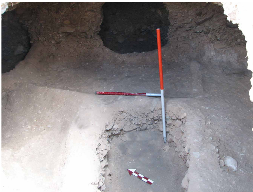
تصویر ۳. گور سردابه‌ای و محل کشف سکه‌های اشکانی، (نعمتی، ۱۳۸۵).