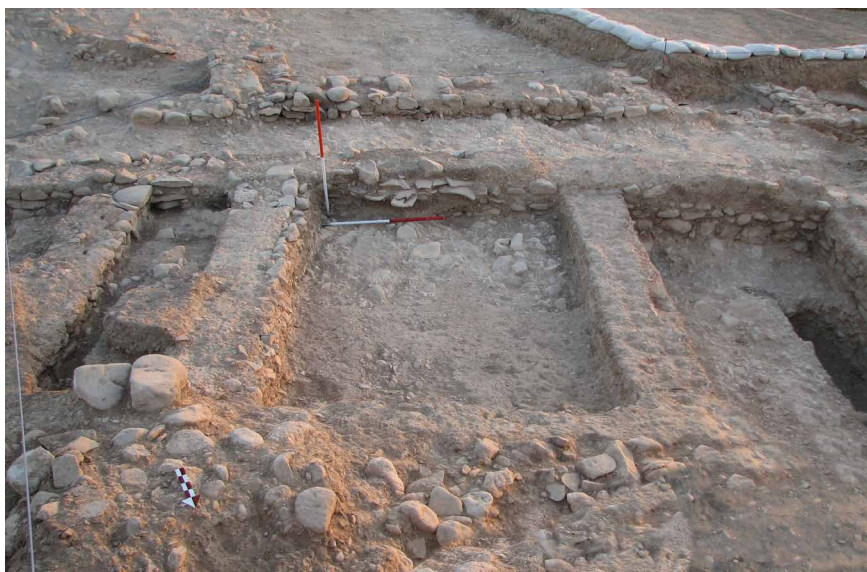
تصویر ۴. محل کشف سکه‌های دوره‌ی ساسانی (کارگاه N15)، (نعمتی، ۱۳۸۵).

سکه‌ی مهرداد سوم (Sellwood, 1980: 124) در زیر گردن اسکلت سکوی شرقی (جدول ۱، سکه‌ی شماره‌ی ۱)، سکه‌ی فرهاد سوم (Ibid: 119) با تاج مخصوص که در وسط آن نقش شاخ یا شعله‌ی جواهر نشان دیده می‌شود و حاشیه‌ی خارجی تاج با گوزن تزئین شده (سرفراز، ۱۳۸۸: ۳۴) در میان بقایای تدفین جمع شده در شمال شرق سکوی شرقی و در لابه‌لای استخوان‌ها و اشیاء (جدول ۱، سکه‌ی شماره‌ی ۲)، سکه‌ی مهرداد دوم با سربندی بر سر (Sellwood, 1980: 73) در استودان یا استخوان دانی که در بدنه‌ی طبیعی گور گنده شده، همراه استخوان‌ها و تعدادی اشیای مختلف (جدول ۱، سکه‌ی شماره‌ی ۳)، سکه‌ی فرهاد سوم (Ibid: 119) در کنار اولین اسکلت دفن شده روی سکوی غربی که متعلق به مردی در حدود ۳۰