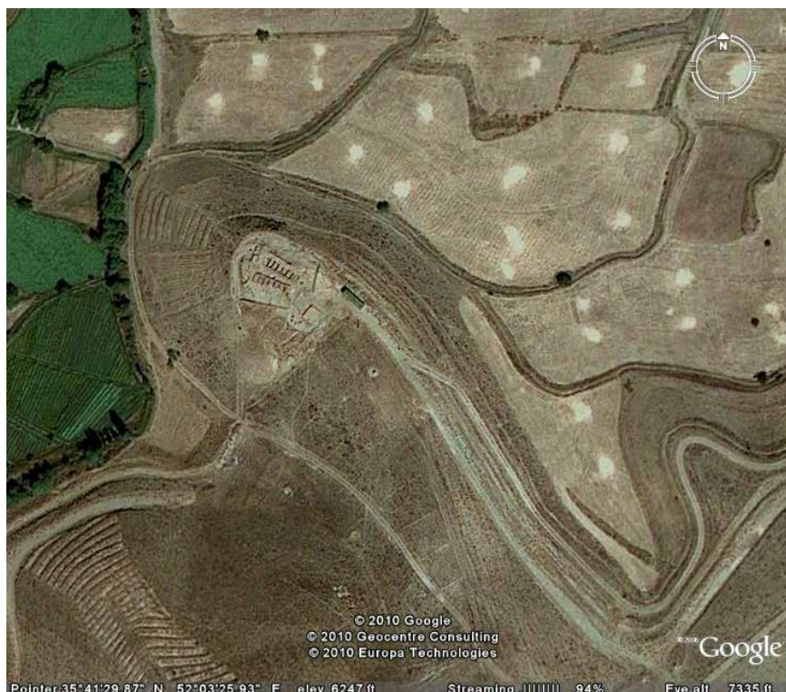
► تصویر ۲. تصویر هوایی محوطه‌ی تاریخی ولیران دماوند (نعمتی، ۱۳۸۶).