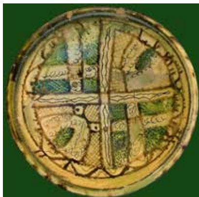
▲ تصویر ۷. سفالینه‌ی نقش‌کنده‌ی خطی روی گلابه با رنگ‌پردازی دورنگ؛ الموت، سده‌ی ۵ ه.ق. (نگارندگان، ۱۳۸۷).