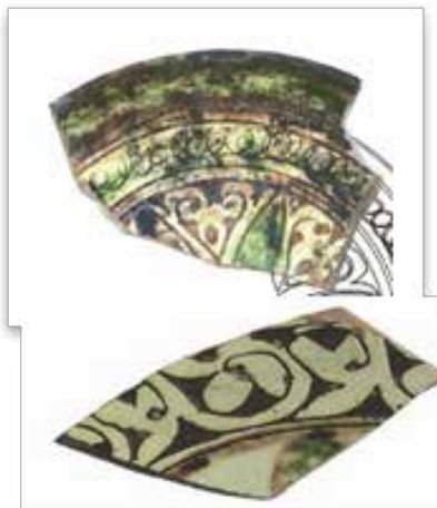
▲ تصویر ۱۳. سفالینه‌ی گلابه‌تراشی؛ الموت، سده‌های ۱۰ و ۱۱ ه.ق. (شاطری، ۱۳۸۸: ۲۱۶).