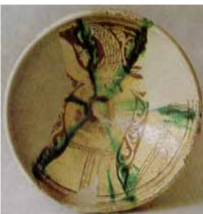
▲ تصویر ۱۲. سفالینه‌ی گلابه‌تراشی؛ تخت‌سلیمان، سده‌ی ۵ ه.ق. (Naumann, 1976: 95).