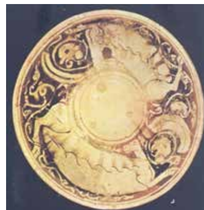
▲ تصویر ۱۱. سفالینه‌ی گلابه‌تراشی؛ کنگاور، سده‌ی ۵ ه.ق. (کریمی و کیانی، ۱۳۶۴: ۱۶۱).