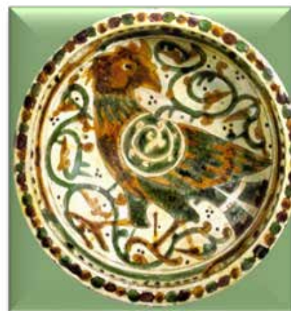
▲ تصویر ۸. سفالینه‌ی نقش‌کنده‌ی خطی در گلابه با لعاب رنگارنگ؛ ایران، سده‌ی ۵ و ۶ ه.ق.، مجموعه‌ی کلکیان (Soustiel, 1985: Pl. 61).