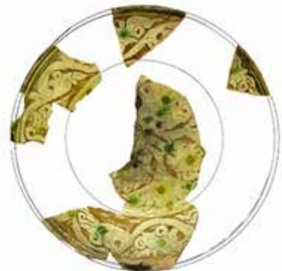
▲ تصویر ۱۰. سفالینه‌ی گلابه‌تراشی؛ جیرفت، سده‌ی ۵ ه.ق. (نگارندگان، ۱۳۸۷).

پژوهش‌های اخیر در محوطه‌هایی همچون آندج (تپه‌ی کاسه‌گران) و یا دژ حسن صباح در منطقه‌ی الموت قزوین، با تکیه بر مطالعات فرم‌شناسی و آزمایشات سالیابی ترمولومینسانس ۱۵ ، تداوم تولید گسترده‌ی گونه‌ی نقش‌کننده در گلابه را حداقل تا سده‌ی ۱۱ ه.ق. و هم‌زمان با دوره‌ی صفوی ثابت نموده است، یعنی چندین سده پس از زمان در نظر گرفته شده برای تولید این گونه (شاطری، ۱۳۸۸: ۱۵۴-۱۵۰)؛ بدین ترتیب ساخت و تولید سفال گونه‌ی نقش‌کننده در گلابه هم‌زمان با هجوم اقوام مغول متوقف نشده و حداقل در برخی میادین عمده‌ی ایران ادامه یافته