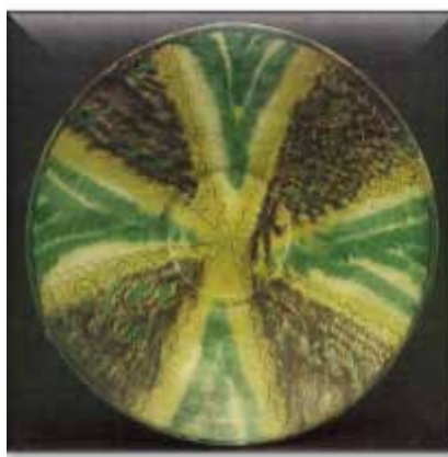
▲ تصویر ۲. سفالینه‌ی نقش‌کنده در گلابه همراه با لعاب‌پاشیده، گرگان حوضه‌ی کاسپین (کیانی، ۱۳۷۹: ۱۹۲).