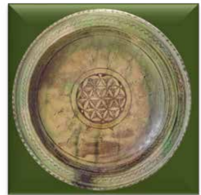
▲ تصویر ۵. سفالینه‌ی نقش‌کنده‌ی خطی ساده با تأثیرپذیری از هنر فلزکاری؛ احتمالاً خراسان، سده‌های ۵ و ۶ ه.ق.، مجموعه‌ی ناصر خلیلی (Grube, 1994: Pic. 130).

فرم و شکل ظروفی که با فن گلابه‌تراشی تزئین شده تنوع بیشتری نسبت به گونه‌ی خطی دارد؛ بدین ترتیب فن تزئینی یاد شده علاوه بر این‌که روی ظروف با اشکال باز هم‌چون کاسه‌ها و بشقاب‌ها، روی ظروف با فرم و اشکال بسته هم‌چون کوزه‌ها و آبخوری‌ها و یا اشکال گوناگون چون ظروف چندخانه ۷ یا پلاک‌ها یا دیوارکوب‌های تزئینی نیز به‌کار رفته است، ولی رایج‌ترین و غالب‌ترین فرم در این گروه هم‌چنان کاسه و بشقاب است.