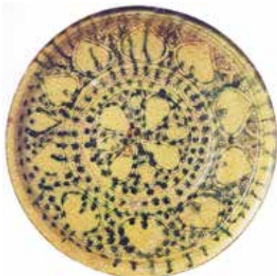
▲ تصویر ۶. سفالینه‌ی نقش‌کنده‌ی خطی روی گلابه با رنگ‌پردازی دورنگ؛ بامیان، سده‌ی ۶ ه.ق.، مجموعه‌ی ناصر خلیلی (Grube, 1994: Pic. 340).