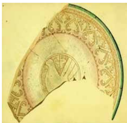
▲ تصویر ۳. سفالینه‌ی نقش‌کنده‌ی خطی ساده با لعاب بی‌رنگ، ری، سده‌ی ۴ ه.ق (Treptow, 2007: p. 37).

Wilkinson, 1973: 74-88; 1977: 90) و کیانی، ۱۳۸۰: ۱۹۲؛ بنابراین آثار قرار گرفته در این گروه را می‌توان از کهن‌ترین نمونه‌های تولید شده‌ی گونه‌ی نقش‌کنده در گلابه دانست. لازم به ذکر است که طی سده‌های بعدی، استفاده از این سبک هم‌چنان ادامه می‌یابد، اما به دلیل پدید آمدن سبک‌های دیگر، از کمیت آن به صورت قابل ملاحظه‌ای کاسته می‌شود (تصاویر ۱ و ۲).