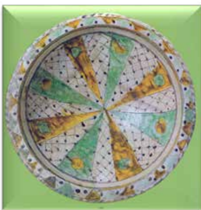
▲ تصویر ۹. سفالینه‌ی نقش‌کنده‌ی خطی در گلابه با لعاب رنگارنگ؛ ایران، سده‌ی ۶ ه.ق.، (گروبه، ۱۳۸۴: تصویر ۱۲۴).

عدم حضور نمونه‌های مناسب تاریخ‌دار در این گروه همواره موجب اختلاف نظر میان پژوهشگران در تاریخ‌گذاری شده است؛ چنان‌که «اشنايدر» پیدایش این گروه را در پی حضور شاهان سلجوقی در سده‌ی ۵ ه.ق. دانسته و دامنه‌ی گسترش آن را از شرق به سوی غرب دانسته و معتقد است این شیوه‌ی تزئینی پس از راه یافتن به مناطق غربی بیشتر در مراکز عمده‌ی مذهبی-سیاسی ایران پیش از اسلام همچون: تخت سلیمان، کنگاور، ارومیه (شیخ‌تپه) و محوطه‌های دیگری که امروزه در همدان گسترده شده‌اند (Schnyder, 1972: 196-194؛ محمدی و شعبانی، ۱۳۹۵: ۱۴۲). «سوستیل» و «گروبه» آثار ساخته شده در قالب این سبک را متعلق به سده‌های ۵ و ۶ ه.ق. دانسته‌اند (Soustiel, 1985: 65-68; Grube, 1994: 115-116)، اما «لین» آن‌ها را متعلق به سده‌های ۶ و ۷ ه.ق. (Lane, 1947: Pic. 31-32) می‌داند؛ ولی آزمایشات ترمولومینسانس بر روی نمونه‌های به دست آمده از الموت نشان داد که فن گلابه‌تراشی تا سده‌ی ۱۰ و ۱۱ ه.ق. نیز در برخی مناطق ساخته می‌شده است (شاطری، ۱۳۸۸: ۱۵۰-۱۵۴). در مجموع آن چه مشخص است، این فن تزئینی به فاصله‌ی زمانی اندکی از سبک نقش‌کنده‌ی خطی پدید آمده و هم‌زمان با آن و در همان کانون‌ها تولید می‌شده است (تصاویر ۱۰ تا ۱۳).