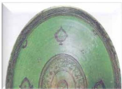
▲ تصویر ۱۴. سفالینه با ترکیب نقش‌کنده‌ی خطی و گلابه‌تراشی؛ ایران، سده‌های ۵ و ۶ ه.ق.، مجموعه‌ی ناصر خلیلی (Grube, 1994: Pic. 132).