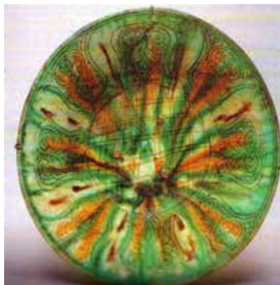
▲ تصویر ۱. سفالینه‌ی نقش‌کنده‌ی خطی در گلابه همراه با لعاب‌پاشیده، نیشابور، سده‌های ۳ یا ۴ ه.ق.، مجموعه‌ی ناصر خلیلی (Wilkinson, 1973: pl.4).