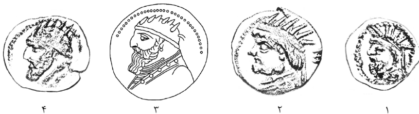
► تصویر ۲. فرمانروایان اشکانی با تاج تابان نمایاننده‌ی فزه‌ی ایزدی؛ ۱ و ۲: فرهاد دوم، ۳ و ۴: مهرداد دوم (افتخاری، ۱۳۹۶: ۳۲ و ۴۸).

بر اساس بررسی‌های انجام‌گرفته در این پژوهش، بر سکه‌های ساسانی، فزه به دو صورت «تصویری» و «نوشتاری» ظهور می‌کند. جنبه‌های تصویری فزه بر این سکه‌ها، تاج آراسته به شاهین یا بال‌های شاهین، تاج تابان، تاج شاخ قوچ، نیم‌تنه‌ی هاله‌دار شاهنشاه در آتشدان و نیم‌تنه‌ی هاله‌دار آناهیتاست. جنبه‌های نوشتاری این مفهوم نیز در نوشته‌ی پشت دینار زرین بوران، در نوشته‌ی «خوزه