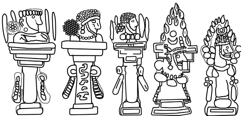
► تصویر ۵. شاهنشاه دارای فزه‌ی شاهی بر آتشدان پشت سکه‌های ساسانی (تصویر ۵-۱): Göbl, 1971, I/1a: ۱-۵; تصویر ۵-۲: Alram & Göbl, 1971, ۳-۵; تصویر ۵-۳: Gyselen, 2003: Ic/3a; تصویر ۵-۴: Göbl, 1971: Ia/6a; تصویر ۵-۵: Göbl, 1971, I/2: ۵-۵; تصویر ۵-۶: Alram and Gyselen, 2003: Ib1/1b; تصویر ۵-۷: پاکزادیان، ۱۳۸۴: ۱۱۹، شماره‌ی ۱۳؛ تصویر ۵-۸: Göbl, 1971: plate IX/149; تصویر ۵-۹: پاکزادیان، ۱۳۸۴: ۱۳۴، شماره‌ی ۲؛ تصویر ۵-۱۰: Göbl, (1971: I. plate IX/178).