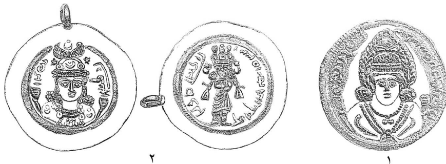
تصویر ۶. ۱: دینار زرین خسرو دوم آپرویز با تصویر آناهیتا (یا ایزد بهرام) در میان هاله‌ی نور (Göbl, 1971: III/4 (plate XIV/217), ۲: دینار زرین بوران (تنها نمونه‌ی شناخته شده)، Museum of Fine Arts, Boston, accession number: 35.272).

برروی تنها دینار زرین به جای مانده از بوران (تصویر ۶-۲) نوشته‌ی 'pzun bur'n' «افزون بوران» و خوانش رابرت گوبل از نوشته‌ی پشت این سکه این است: bur'n tlyn / بوران / [سال شاهی] دو «و gyh'n MN GDH nyw klt'1 [او که] زمین را با فَرّه‌ی خویش نیرومند می‌سازد» (امینی، ۱۳۹۲: ۱۰۸).