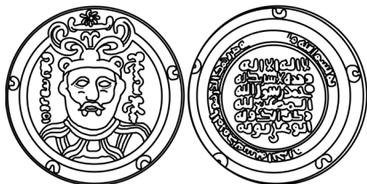
▲ تصویر ۸. درهم سیمین رکن‌الدوله حسن بن بویه، فرمانروای بویی (مایلز، ۱۳۹۰: تصویر ۳/۲۸).

آخرین بار، هم نگاره و هم نوشتار فره، این مفهوم جادویی و آسمانی، را بر سکه‌ای بویی می‌بینیم. باسورت، گرایش بوییان را به مذهب شیعه و این‌که نسب خود را به ساسانیان می‌رسانند، نشانه‌ی ملی‌گرایی آنان می‌دانست (Bosworth, 1980: 96). مایلز، یک «نشان» زرین از فناخسرو عضالدوله ضرب سال ۳۵۹ ه.ق. در فارس و نیز چند «سکه‌ی تشریفاتی» زرین از عزالدوله ضرب سال‌های ۳۶۳ و ۳۶۵ ه.ق. در بغداد را معرفی می‌کند که به سبک و سیاق ساسانی‌اند (مایلز، ۱۳۹۰: ۳۲۷). یگانه سکه‌ی بویی به این سبک را رکن‌الدوله‌ی بویی در سال ۳۵۱ ه.ق. در محمدیه (= ری) ضرب کرده بود که روی آن نیم‌تنه‌ی رکن‌الدوله، تاج آراسته به بال و ماه و ستاره بر سر، را روبه‌رو نشان می‌دهد (تصویر ۸)؛ سوی چپ آن نوشته‌ی پهلوی ساسانی GDH 'pzw / xwarrah abzūd / «خوزه افزود» و سوی راست آن نوشته‌ی پهلوی ساسانی /MLKAn MLKA /šāhān šāh / «شاهانشاه» است. پشت سکه به خط کوفی «لا اله الا الله وحده لا شریک له محمد رسول الله / المطیع لله / رکن‌الدوله ابوعلی بویه» و پیرامون آن «بسم الله ضرب هذا الدرهم بالمحمدیه سنه احدی و خمسین و ثلثمائه» (به نام خدا این درهم در محمدیه در سال ۳۵۱ زده شد) نگاشته شده است. این سکه، واپسین سکه‌ای است که به سبک سکه‌های ساسانی و نیز با نوشته‌ی پهلوی ساسانی ضرب شده است.