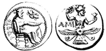
▲ تصویر ۱. ۱) سکه‌ی تریباز با فزه‌ی ایزدی، ۲) سکه‌ی ترکمووه با فزه‌ی ایرانی (ویژه‌هوفر، ۱۳۹۲: ۲۲۶).

فزه بر سکه‌های اشکانی به هر دو صورت نوشته و نگاره (= تصویر) ظهور می‌کند. جنبه‌های تصویری فزه بر سکه‌های اشکانی شاهین و تاج تابان فرمانروای اشکانی است. شاهین سکه‌های اشکانی در ارتباط با فزه است. به نظر می‌رسد از زمان ارد دوم (۵۷-۳۸ ق. م.)، پسر فرهاد سوم، شاهینی که دیهیمی در نوک داشت، نشان «پیروزی بر شاه رقیب داخلی» می‌شود و اعطای دیهیم توسط شاهین حکم اعطای فزه‌ای داشت که تنها بر سر یک شاه می‌توانست جای خوش کند؛ این نکته را اسناد