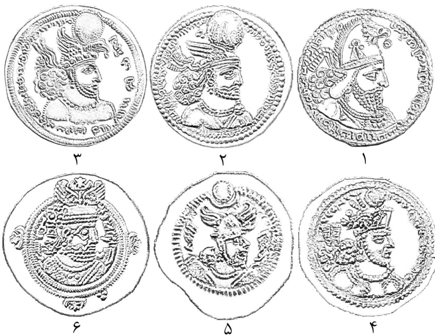
► تصویر ۳. شاهنشاهان ساسانی با تاج‌های آراسته به شاهین یا بال شاهین؛ ۱: شاپور یکم (Göbl, 1971: IV/1)، ۲: بهرام دوم (Göbl, 1971: I/1; plate III/50v)، ۳: اردشیر دوم (Göbl, 1971: I/3; plate IV)، ۴: بهرام چهارم (Göbl, 1971: VIII/141)، ۵: پیروز (Göbl, 1971: III/1; plate V/175)، ۶: خسرو دوم آپرویز (Göbl, 1971: III/1; plate V/175).

بر یک درهم سیمین شاپور یکم تاج وی آراسته به نیم‌تنه‌ی شاهینی است که گویی کوچک در نوک دارد (تصویر ۳-۱)، همین شاهین با گوی در نوک بر تاج اردشیر دوم دیده می‌شود که با بال‌هایش تصویر شده است (تصویر ۳-۳)؛ تاج‌های بهرام دوم و بهرام چهارم آراسته به بال شاهین است که سوی راست آن بال دیده می‌شود (تصویر ۳-۲ و ۳-۴) اما تاج‌های پیروز (تصویر ۳-۵) و خسرو دوم (تصویر ۳-۶) دو بال شاهین را روبه‌رو نمایش می‌دهند. جز قباد دوم، همه‌ی شاهنشاهان ساسانی پس از خسرو دوم، همین تاج با بال‌های شاهین خسرو دوم را بر سر می‌نهادند. پس از اسلام، این تاج به همین شکل بر سکه‌های عرب-ساسانی، اسپهبدان تبرستان، عرب-تبرستانی، عرب-سیستانی و رکن‌الدوله‌ی بویی (واپسین نمونه‌ی سکه با تاج خسرو دوم: ۳۵۱ هـ.ق.) دیده می‌شود (ن. ک. به: رضائی باغبیدی، ۲۰۹-۲۲۲ و مایلز، ۳۲۷: ۱۳۹۰).