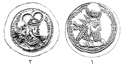
▲ تصویر ۱.۴: بهرام یکم با تاج تابان (Göbl, 1971: I/1). ۲: یکی از کوشان‌شاهان با تاج شاخ قوچ بر پشت درهم سیمین یزدگرد یکم (پاکزادیان، ۱۳۸۴: ۱۳۱).

بر آتشدان پشت شماری از سکه‌های ساسانی، نیم‌تنه‌ای مذکر با هاله‌ی نور یا شعله‌های آتش تصویر شده که نشانگر فره‌ی کیانی یا شاهی اوست. از نمونه‌های فراوانی که بر آن‌ها تصویر نیم‌تنه‌ی پشت سکه از نظر چهره و آرایش و تاج و تن‌پوش کاملاً با نیم‌تنه‌ی پادشاه ساسانی روی سکه مطابقت دارد، به این نتیجه می‌رسیم که فرد میان هاله‌ی نور، همان شاهنشاه ساسانی روی سکه است. این نوآوری نمایش فره‌ی شاهنشاه بر پشت سکه‌ی ساسانی، نخستین بار در زمان هرمزد دوم ساسانی (۳۰۲-۳۰۹ م.) انجام گرفت و در زمان بلاش (۴۸۴-۴۸۸ م.) شاهد آخرین نمونه‌های آن هستیم. معمولاً این نیم‌تنه‌ی شاهنشاه را که دارای فره‌ی شاهی است بر پشت بعضی از سکه‌های یک فرمانروای ساسانی، و نه همه‌ی سکه‌هایش، شاهد هستیم. نیم‌تنه‌ی هرمزد دوم فره‌دار را گاه رو به چپ (تصویر ۵-۱)، گاه رو به رو (تصویر ۵-۲) و گاه هم‌آهنگ با تصویر نیم‌تنه‌ی شاهنشاه روی سکه‌ی ساسانی، رو به راست نمایش داده‌اند (تصویر ۵-۳). از این پس، همیشه نیم‌تنه‌ی فره‌دار پشت سکه رو به راست می‌شود. نیم‌تنه‌ی دارای فره‌ی شاپور دوم (۳۰۹-۳۷۹ م.)