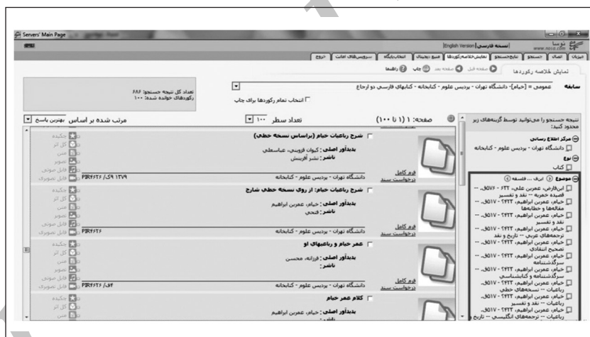
شکل ۲. نمونه‌ای از جستجو در خانواده کتابشناختی رباعیات خیام در نرم‌افزار سیمرغ و نمایش درخت‌واره پدیدآور

در شکل ۳ نمونه‌ای از جستجوی انجام‌شده در نرم‌افزار رسا کتابخانه ملی ایران با کلیدواژه‌های "بوستان" و "سعیدی، مصلح‌بن عبدالله" نشان داده شده است.