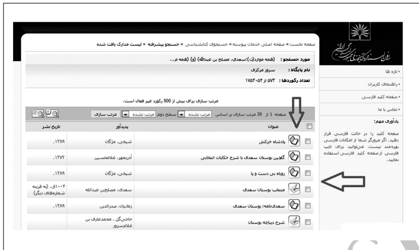
شکل ۳. نمونه‌ای از جستجو در خانواده کتابشناختی بوستان سعدی در نرم‌افزار رسا و نمایش نتایج بازیابی شده

نمودارهای ۱ و ۲ به‌طور مجزا میزان موفقیت کاربران در پیوند با وظایف کاربری الگوی مفهومی اف.آر.بی.آر. یک بیان از خانواده کتابشناختی بوستان سعدی و رباعیات خیام در نرم‌افزارهای کتابخانه‌ای مذکور را نشان می‌دهند.