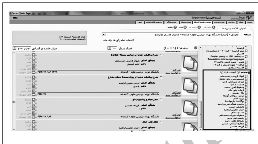
شکل ۱. نمونه‌ای از جستجو در خانواده کتابشناختی رباعیات خیام در نرم‌افزار سیمرغ و نمایش درخت‌واره موضوع