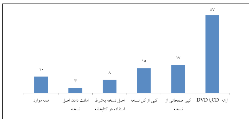
نمودار ۳. نوع نسخه تحویلی در کتابخانه‌ها