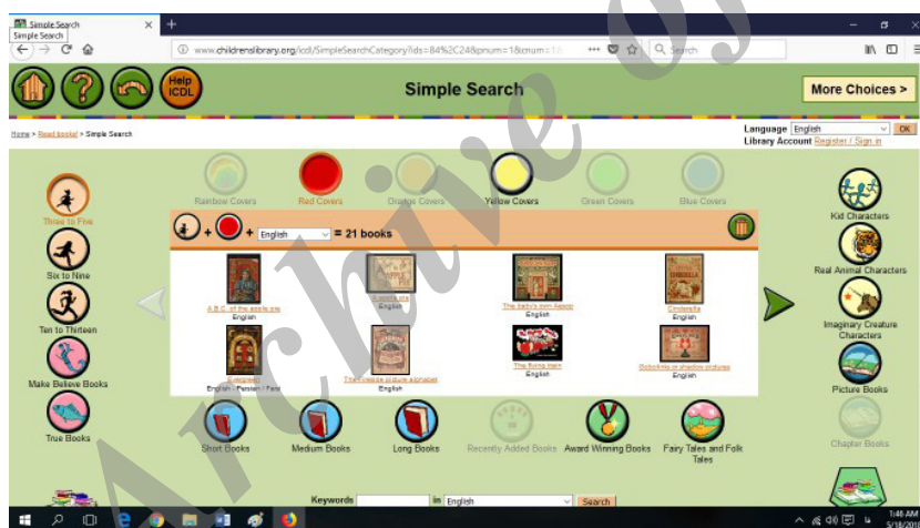
شکل ۱. نمونه‌ای از یک جستجوی ساده

برای ارزیابی رده‌هایی که بیشترین استفاده از ICDL را داشتند، پژوهشگر از شرکت‌کنندگان خواست تا کتابی را از مقوله‌های مورد علاقه خود انتخاب کنند. یافته‌ها نشان داد که اکثر کودکان سطح ابتدایی کتاب را بر اساس رنگ جلد و نوع ادبی انتخاب می‌کردند. درحالی که کتاب‌های محبوب دانش‌آموزان دوره راهنمایی براساس موضوع و نوع ادبی بود. بنابراین، رده ژانر یا نوع ادبی در اولویت اصلی انتخاب مشترک در هر دو گروه بود. شرکت‌کنندگان تمایلی به جستجوی کتاب‌های دسته‌بندی‌شده براساس امتیاز اختصاص یافته نداشتند. علاقه‌مند بودند خودشان به کتاب‌ها امتیاز بدهند. یکی از شرکت‌کنندگان دوره راهنمایی پیشنهاد کرد که بهتر است استفاده‌کنندگان بتوانند آیکن انتخابی خود را که به صورت ناخواسته (اشتباهی) انتخاب شده، مستقلاً حذف کنند. شکل زیر نمونه‌ای از نتیجه یک جستجوی ساده است. در این نمونه سه دسته با هم ترکیب شده است. این دسته‌بندی‌ها عبارت‌اند از: رنگ جلد کتاب، سن و زبان خواننده.