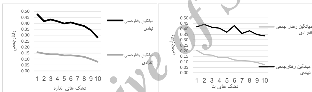
شکل (۱) رفتار جمعی و اندازه

با توجه به مقدار احتمال آماره که معادل صفر است، فرضیه اول رد می‌شود و در نتیجه رفتار جمعی سرمایه گذاران نهادی به‌طور معناداری بیشتر از سرمایه گذاران انفرادی است. در بررسی اثر ویژگی‌های بنیادی شرکت در رفتار جمعی، ابتدا میانگین رفتار جمعی ماهانه و ویژگی‌های بنیادی شرکت شامل اندازه،