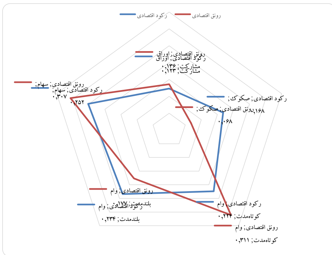
شکل (۳) وزن‌های ANP برای هر یک از گزینه‌های تأمین مالی

وزن‌های به‌دست‌آمده از الگوی ANP که در جدول ۹ ذکر شده است، می‌تواند به‌عنوان راهنمایی کلی به تصمیم‌گیری درباره میزان بهره‌گیری از منابع مختلف تأمین مالی کمک کند. شکل ۳ میزان گرایش به هر منبع را تحت هر یک از دو سناریو نشان می‌دهد. باید توجه داشت که این نتایج، حاصل ترکیب نظر خبرگان و داده‌های آماری واقعی است که با رویکرد خاصی در یک الگوی تصمیم‌گیری چندمعیاره گنجانیده شده است؛ بنابراین، این وزن‌ها را نمی‌توان به‌عنوان نسخه عامی برای همه شرکت‌های نمونه