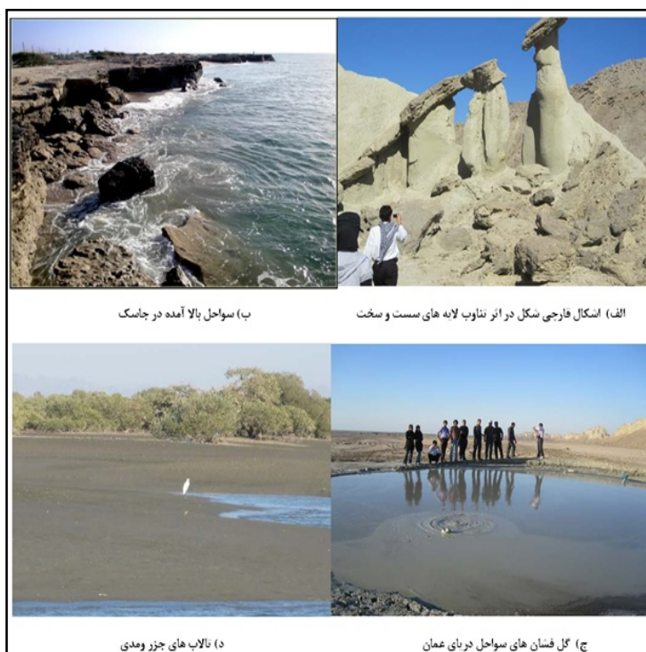
شکل (۱): ژئومورفوسایت‌های مورد مطالعه در استان هرمزگان

در این بخش با استفاده از بررسی‌های میدانی و کتابخانه‌ها، مفاهیم اساسی و ویژگی‌های ژئومورفولوژیکی این چشم‌اندازها مورد بررسی اجمالی قرار گرفته است که در جدول ۴ توضیحات اجمالی آن درج شده است.