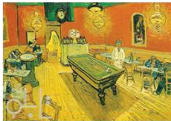
کافه شبانه ۱۸۸۸

(ترجمه: پس آه ای باران! / دوست داریم ای کاش از نو می‌خوایدیم / دوست داریم ای کاش از نو می‌مردیم / زیرا خواب ما، جوانه‌های بیداری است / و مرگ ما زندگی را پنهان می‌سازد).