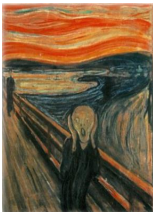
جیغ اثر ادوارد مونش ۱۸۹۳

«اکسپرسیونیسم» را چنین تعریف می‌کند: «هنر اکسپرسیونیسم هنری است که یک فشار یا ضرورت درونی را آزاد می‌کند. این فشار بر اثر عاطفه یا احساس ایجاد می‌شود و اثر هنری به صورت مفر یا دریچه‌ای درمی‌آید که به وسیله آن تأثیر روانی تحمل‌ناپذیر به تعادل مبدل می‌شود. آزاد شدن نیروی روانی به این صورت ممکن است به حرکات تند منجر شود و ظواهر امور طبیعی را چنان دگرگون کند که زشت به نظر آید.» (۱۳۷۱: ۱۸۳)