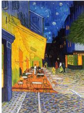
تراس کافه در شب ۱۸۸۸

میخانه‌ای: «چو تب مهربان و صمیمی / میخانه‌های غم‌آلود با سقف کوتاه و ضربی / و روشنی‌های گم‌گشته در دود؛ و یاری که با او همراه است گویی خود وان گوگ است؛ زیرا او هم آنچه را اخوان دیده به تصویر کشیده است. «هر جا که من گفتم، آمد این گوشه آن گوشه شب / هر جا که من رفتم آمد / او دید من نیز دیدم. دور از اندیشه نیست که هنرمندان هم آرا، سایه یکدیگر در آفرینش آثارشان باشند.» (اخوان ثالث، ۱۳۶۰: ۹۸-۹۹)