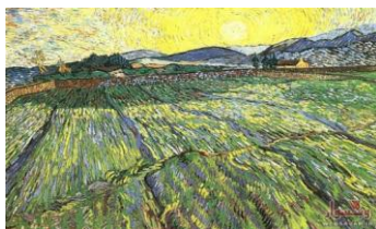
مزرعه هنگام طلوع خورشید، ۱۸۸۹

(ترجمه: جیکور جیکور متولد خواهد شد/ گل‌ها و شکوفه‌ها، برگ‌ها خواهند داد/ جیکور، متولد خواهد شد از مجروحان/ از اندوه مردگان... از آتش درون من/ کشتزار، سرشار از گندم می‌شود/ انبار آذوقه به صبح لبخند می‌زند.) رنگ این تابلو پُر از رنگ‌های بوم و پالتِ وان‌گوگ است، زرد، قرمز، سبید. آتش، گندم، شکوفه، صبح و لبخند سرشار از رنگ‌های روشن و خالص امپرسیونیستی است. هرچند درون شاعر از شادی سرشار نیست؛ ولی رنگ‌های وان‌گوگ در آن می‌درخشد. جمله‌های کوتاه ضرباهنگ قلم‌مو بر بوم را به‌یاد می‌آورد. پر از امید در میان انبوه ناامیدی و حسرت. انبار آذوقه به صبح لبخند می‌زند. جای لب و لبخند در این تصویر تازه با درخشش دندان صبح در تصاویر کهن جابه‌جا شده است. این‌بار لبخند و برکت از آن زمین است.